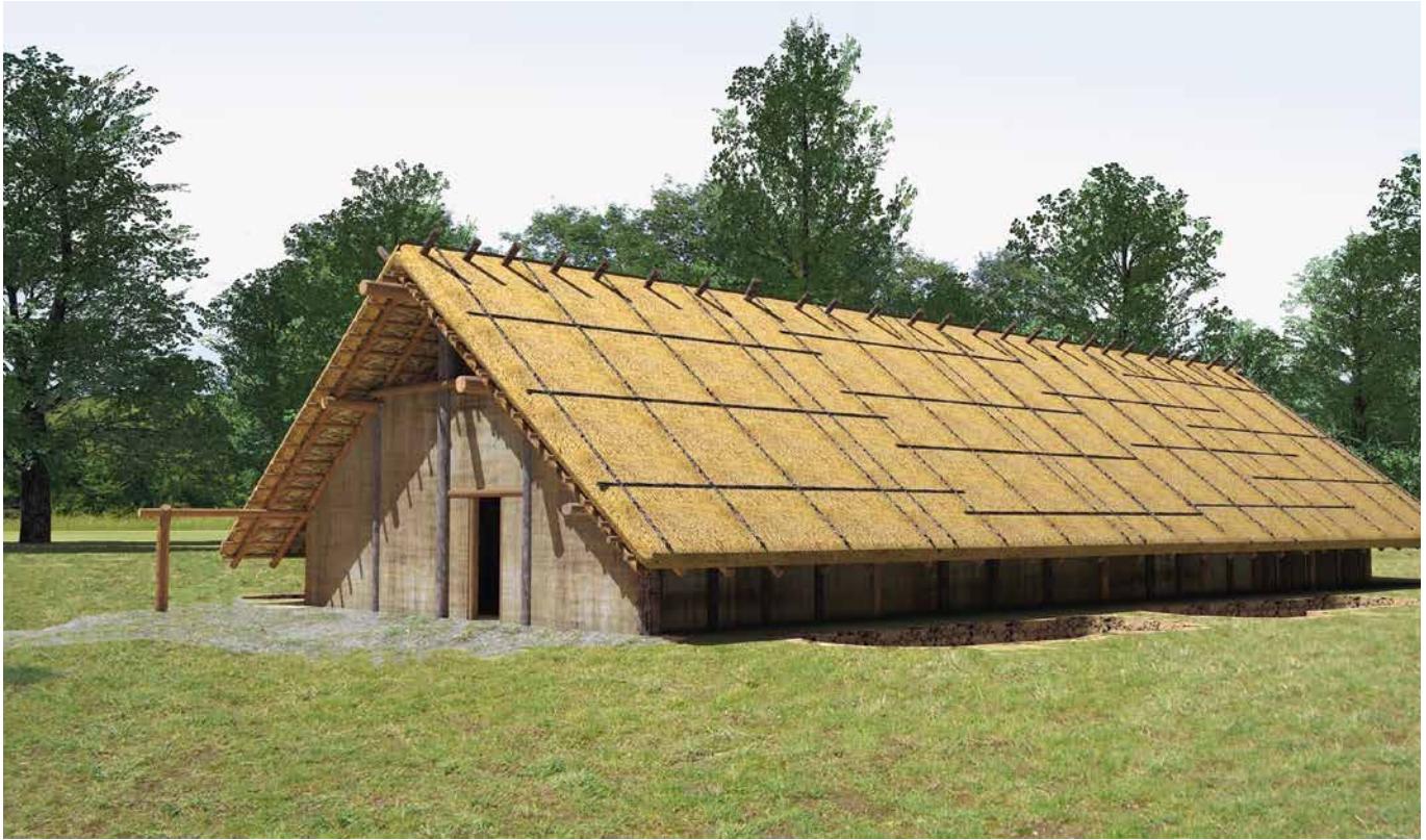
ABB. 3 Idealrekonstruktion eines bandkeramischen Langhauses (3D-Computerrekonstruktion: R. Seidel, Neustadt/Weinstr.).

nannten „Hüttenlehms“ auftritt. Brennt ein Gebäude ab oder liegt eine Feuerstelle nahe an der Hauswand, so verziegelt der Lehm, wird also sehr fest und bewahrt als Abdruck die Weidenruten und die Konstruktionsmerkmale des Wandaufbaus. Wie jedoch das Dach gedeckt war, ob es Fensterhöhlungen in den Wänden gab und wie viele Eingänge ein solches Langhaus hatte, bleibt Gegenstand unterschiedlicher Spekulationen, da wir keine Wanderhaltung im Ganzen kennen und auch vom Dach nie etwas die Jahrtausende überdauert hat. Dennoch kann man sich ein gutes Bild eines bandkeramischen Hauses anhand der uns zur Verfügung stehenden Informationen machen (Abb. 3).