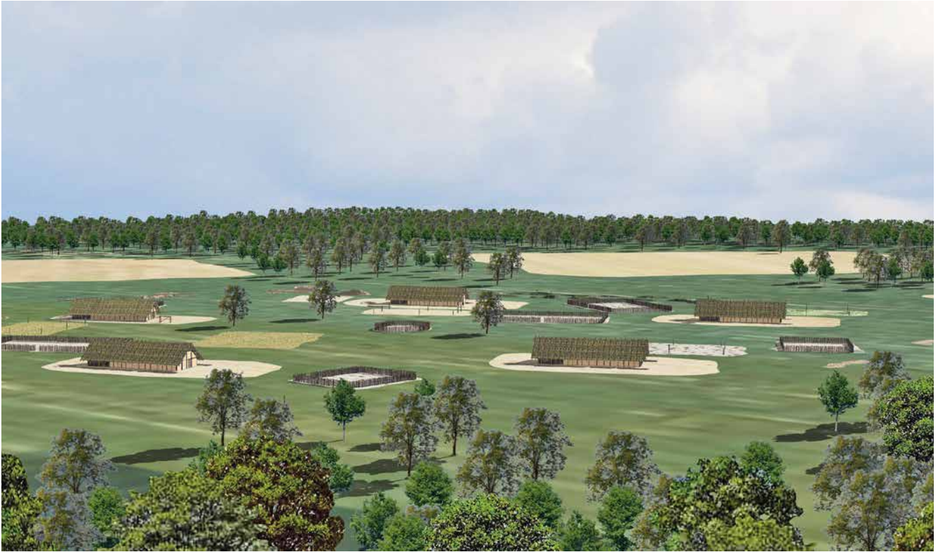
ABB. 4 Idealrekonstruktion eines bandkeramischen Weilers mit wenigen Häusern. Jedes Haus besitzt ein Hofareal, auf dem verschiedene Tätigkeiten durchgeführt wurden (3D-Computerrekonstruktion: R. Seidel, Neustadt/Weinstr.).