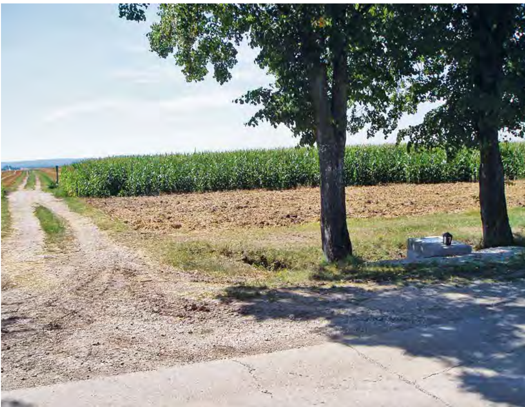
ABB. 7 Rekultivierung: Pipeline ist, wenn man keine sieht.