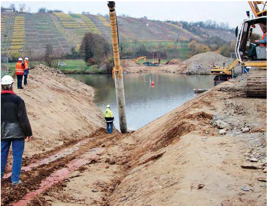
ABB. 5 Einzug des Dükers am Neckar (Foto: EPS Ethylen-Pipeline-Süd GmbH & Co KG).