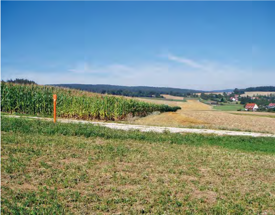
ABB. 6 Rekultivierung: Nur die orangefarbenen Markierungspfeiler weisen auf die EPS hin.