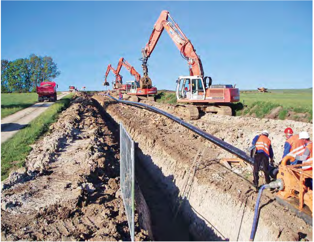
ABB. 4 Raumsparend: Der Trassenbau.