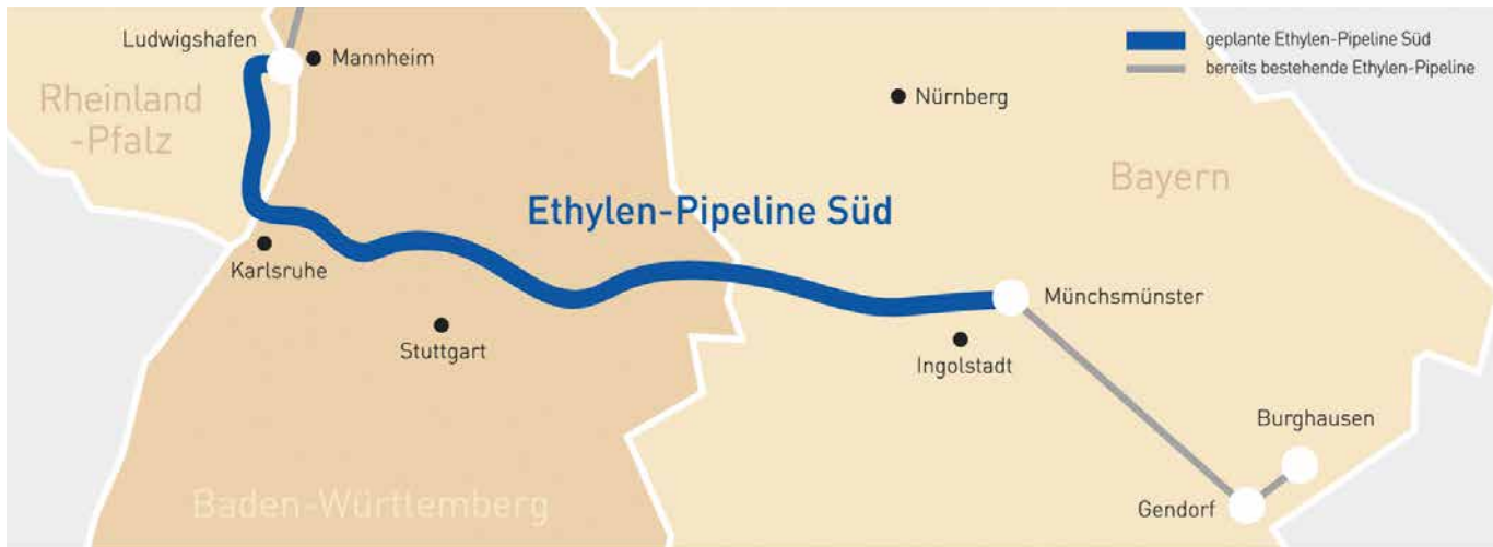
ABB. 1 Von Münchsmünster bis Ludwigshafen: Die Strecke der EPS (Grafik: EPS Ethylen-Pipeline-Süd GmbH & Co KG).