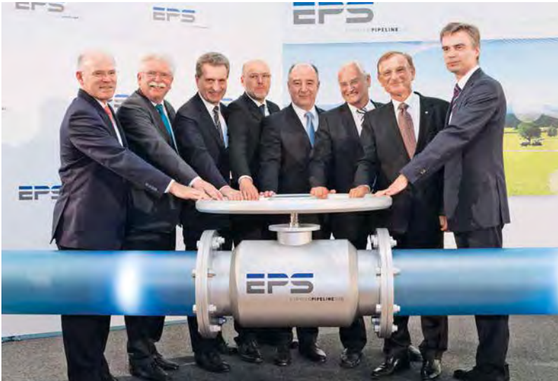
ABB. 9 Festakt zur Inbetriebnahme der EPS am 19. Juli 2013 in München: Den Befehl „Ethylen marsch“ gaben u. a. EU-Energie-Kommissar Günther Oettinger (3. von links) und Bayerns Wirtschaftsminister Martin Zeil (2. von links).