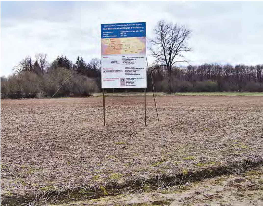
ABB. 2 Tafeln künden vom baldigen Baubeginn (Foto: EPS Ethylen-Pipeline-Süd GmbH & Co KG).

lange von Mensch und Natur. Trotzdem kommt es häufig zu Auseinandersetzungen zwischen den Handelnden und den Betroffenen, zu Kollisionen von Werten und zu oft zäh errungenen Konflikten um die vermeintlich beste Lösung. So standen bei der Trassenführung der EPS die Fragen der Sicherheit und des Schutzes von Mensch und Umwelt an erster Stelle. Spezielle Aspekte der Siedlungsstruktur, des Städtebaus sowie des Natur- und Landschaftsschutzes wurden berücksichtigt. Um das Projekt landschaftschonend durchzuführen, verläuft die geplante Trasse auf 320 km parallel zu bestehenden Versorgungsleitungen. Aus Rücksicht auf lokale Besonderheiten verlängerte sich die projektierte Gesamtlänge von 360 auf 370 km. Bau und Rekulтивierung wurden so sorgfältig ausgeführt, dass die landwirtschaftliche Nutzung unmittelbar danach wieder möglich war. Der Weg zur Inbetriebnahme verlangte dem Projektmanagement alles ab (Abb. 3). Es gab Höhen und Tiefen, Konflikte und Verzögerungen. Doch am Schluss waren auch schwierigste Phasen überwunden. Was also hat die EPS GmbH und Co. KG bei ihrer schwierigen Aufgabe richtig gemacht?