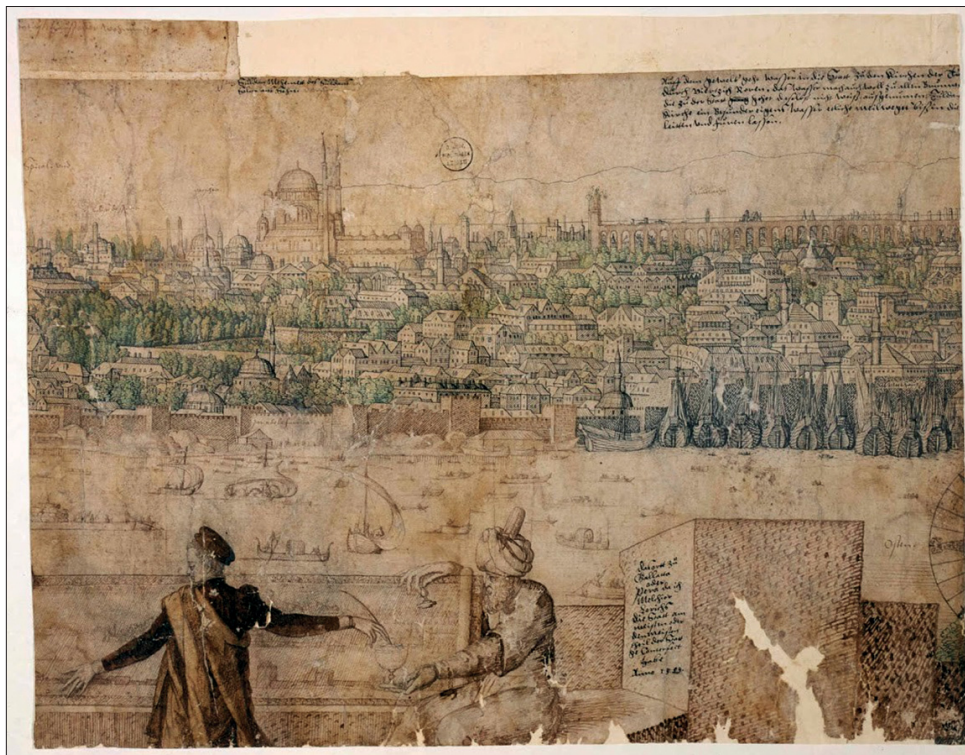
Abb. 1 Ansicht des Unkapani-Areals (im Bild rechts) am Goldenen Horn von Galata her, erstellt von Melchior Lorichs 1558/1561. – (Nach Fischer, Lorck, Blatt 11).

den 26. Oktober 1369 datiertes venezianisches Dokument zu, das im Rahmen eines Disputs mit dem byzantinischen Kaiser über die Plätze des (abgabefreien) Handels mit Getreide durch die Venezianer erstellt wurde 74 . Der Großteil der Getreideversorgung des spätbyzantinischen und osmanischen Konstantinopel stammte aus den Gebieten am Schwarzen Meer, von dem her kommend sich das Goldene Horn als erster Hafen anbot 75 . Die Anlegestellen bei Unkapani dienten aber auch als wichtiger Umschlagplatz für den Transport von Baumaterial, insbesondere Steinen, für die unter Sultan Süleyman dem Prächtigen (1520-1566) errichtete Süleymaniye-Moschee 76 . Ein anschauliches Bild nicht nur des Unkapani-Areals (auf Blatt 11-12, auch hier mit der Bezeichnung porta de la farina bzw. mul Thor ), sondern des gesamten Schiffsverkehrs und der Anlegestellen am Goldenen Horn bietet für diese Zeit die um 1558/1561 von Melchior Lorichs erstellte Ansicht von Galata her (Abb. 1) 77 . Sie illustriert die Nutzung des Goldenes Horns in seiner Gesamtheit als Hafen; auch