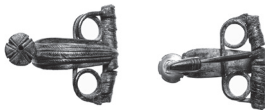
Fig. 121 Fíbula ofrecida para su compra al RGZM. – Sin escala.