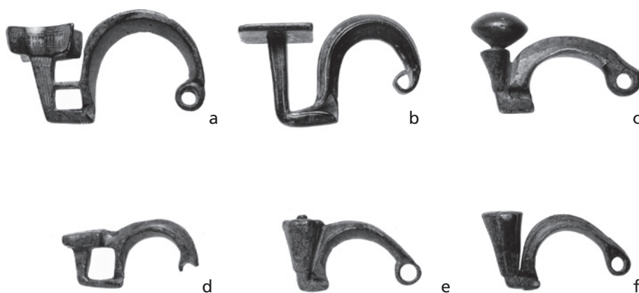
Fig. 122 Fíbulas ofrecidas para su compra al RGZM. – Sin escala.

das por un remache cuya cabeza sobresale, lo que parece ser un recurso esencialmente decorativo, pone en relación ambas series y tradiciones metalúrgicas, evidente dada la similitud con algunos ejemplares procedentes de este cementerio burgales 995 .