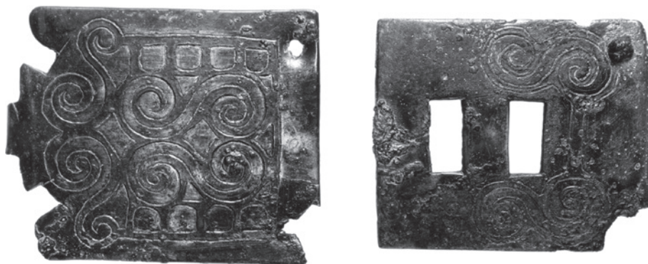
Fig. 119 Broche de cinturón (placas activa y pasiva) ofrecido para su compra al RGZM. – Sin escala.