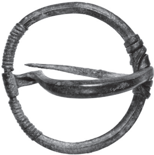
Fig. 123 Fíbula ofrecida para su compra al RGZM.