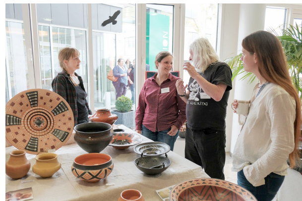
Ausstellung und Posterpräsentationen / Marché des possibilités avec expositions (Fotos: A. Elsässer).

romains monumentaux à Oberlöstern, la villa romaine de Mehring, l'exposition permanente du Rheinisches Landesmuseum de Trèves ainsi que les monuments romains, la Cathédrale et l'église Liebfrauenkirche de Trèves classés au patrimoine mondial de l'UNESCO, avec les stations des thermes impériaux et de l'amphithéâtre.