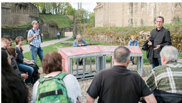
Exkursion 1: Gondwana – das Praehistorium (Stefan Mörsdorf). Exk. 2: Grabhügel von Oberlöstern (Edith Glansdorp). Exk. 3: Villa von Mehring (Stefan Seiler). Exk. 4: Rheinisches Landesmuseum Trier „Im Reich der Schatten“ (Frank Unruh). Exk. 5: Kaiserthermen und Amphitheater Trier (Georg Breitner) (Leitung Michael Koch).

Bonifas (D'Georges Kayser Altertumsfuerscher, Luxembourg) - Felix Fleischer (Archéologie Alsace, France) - Michaël Landolt (DRAC, France) - Foni Le Brun-Ricalens (CNRA, Luxembourg) - Julian Wiethold (Inrap Grand Est, Metz, France) - Andrea Zeeb-Lanz (GDKE Rheinland-Pfalz, Allemagne) - Stephanie E. Metz (GDKE Rheinland-Pfalz / Rheinisches Landesmuseum Trier, Allemagne).