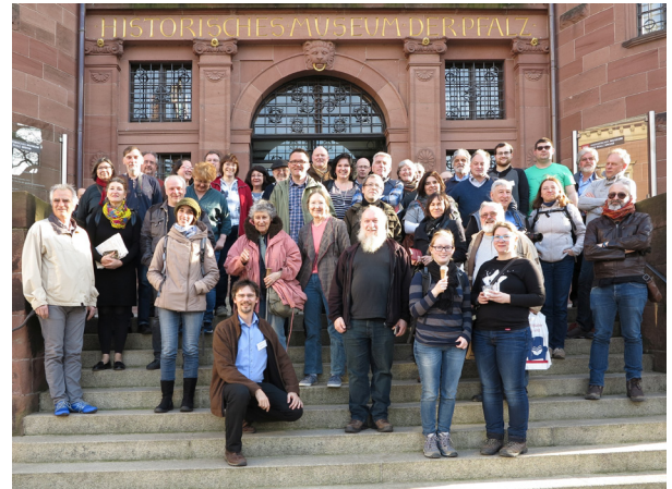
Exkursion 2: a) Museum Herxheim - Jungsteinzeit und rituelle Menschenopfer. b) Historisches Museum der Pfalz in Speyer mit Sonderausstellung „Maya - das Rätsel der Königsstädte.“ / Excursion 2 : a) Musée de Herxheim : Période néolithique et sacrifices humains rituels. b) Musée historique du Palatinat à Speyer avec exposition spéciale « La civilisation maya – l'énigme des cités royales » (Fotos: M. Koch, H.-W. Schepper).