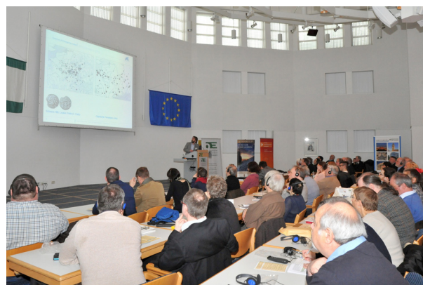
Impressionen von den Archäologentagen 2017 / Impressions réunies lors des Journées archéologiques 2017 (Fotos: V. Braun).