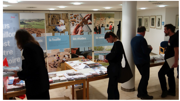
Markt der Möglichkeiten mit Ausstellung und Posterpräsentationen / Marché des possibilités avec expositions.