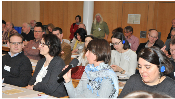
Impressionen von den Archäologentagen 2017 / Impressions réunies lors des Journées archéologiques 2017.