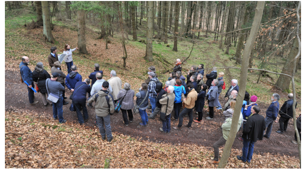
Exkursion 1: a) Heimatmuseum Neipel. b) Die Höhenbefestigung „Birg“ / Excursion 1 : a) Musée local de Neipel. b) La « Birg », fortification d'hauteur.