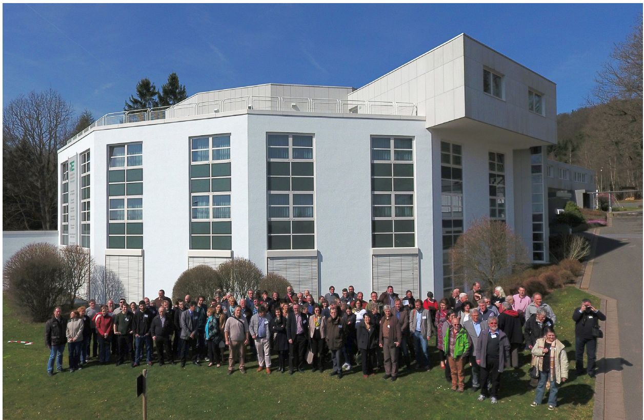
Impressionen von den Archäologentagen 2017 / Impressions réunies lors des Journées archéologiques 2017.