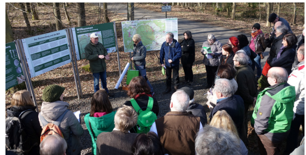
Exkursion 2: Oppidum Donnersberg / Excursion 2 : l'oppidum du Donnersberg.