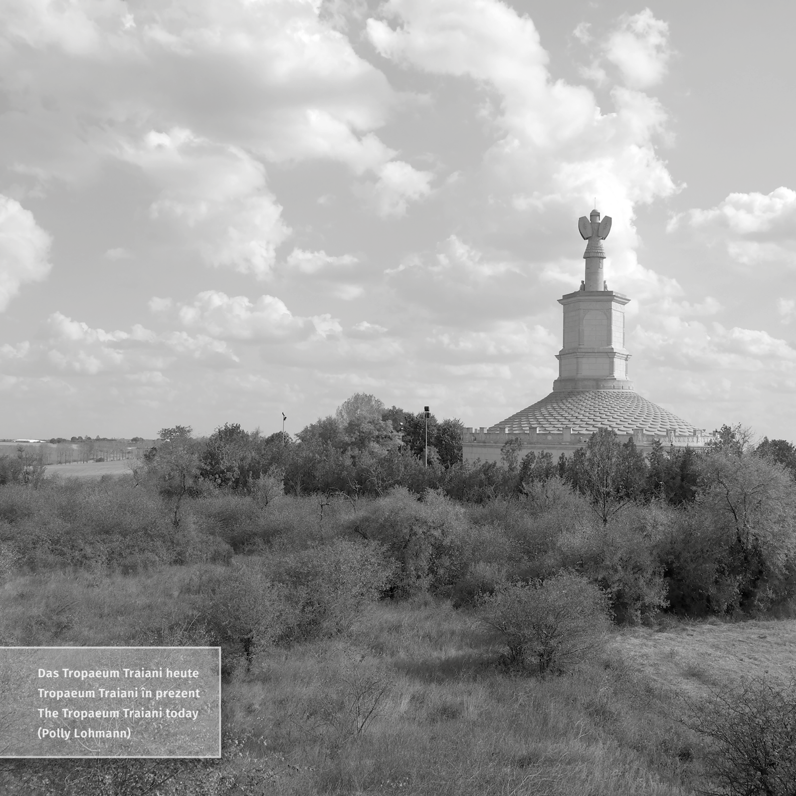
Das Tropaeum Traiani heute Tropaeum Traiani în prezent The Tropaeum Traiani today (Polly Lohmann)