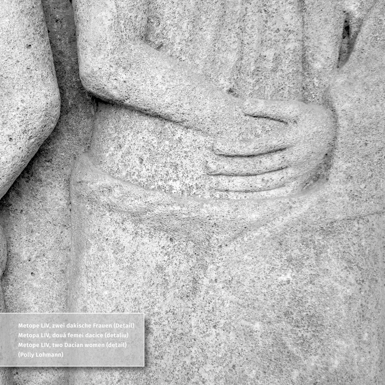
Metope LIV, zwei dakische Frauen (Detail) Metopa LIV, două femei dacice (detaliu) Metope LIV, two Dacian women (detail) (Polly Lohmann)