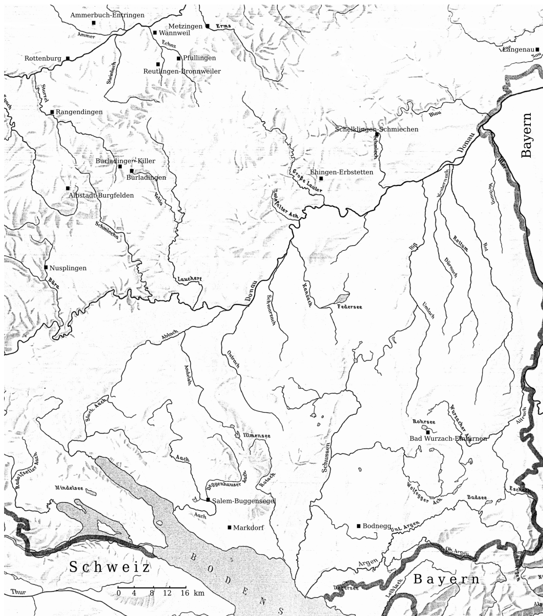
Abb. 55 Kirchen mit nahen Reihengräbern, römischen Resten und/oder Chorschranke (Tabelle 4)