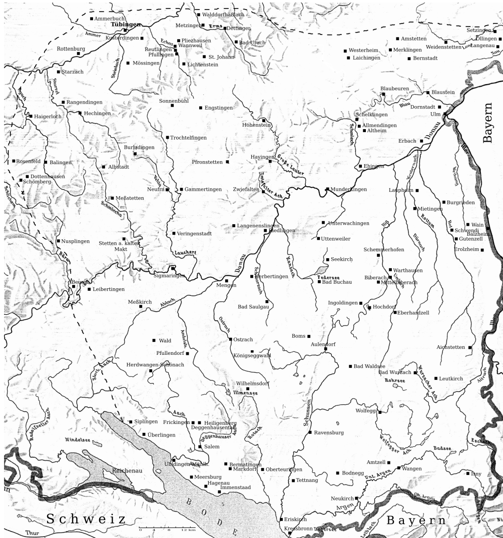
Abb. 50 Grabungen in Kirchen (Siehe Tabelle 2)