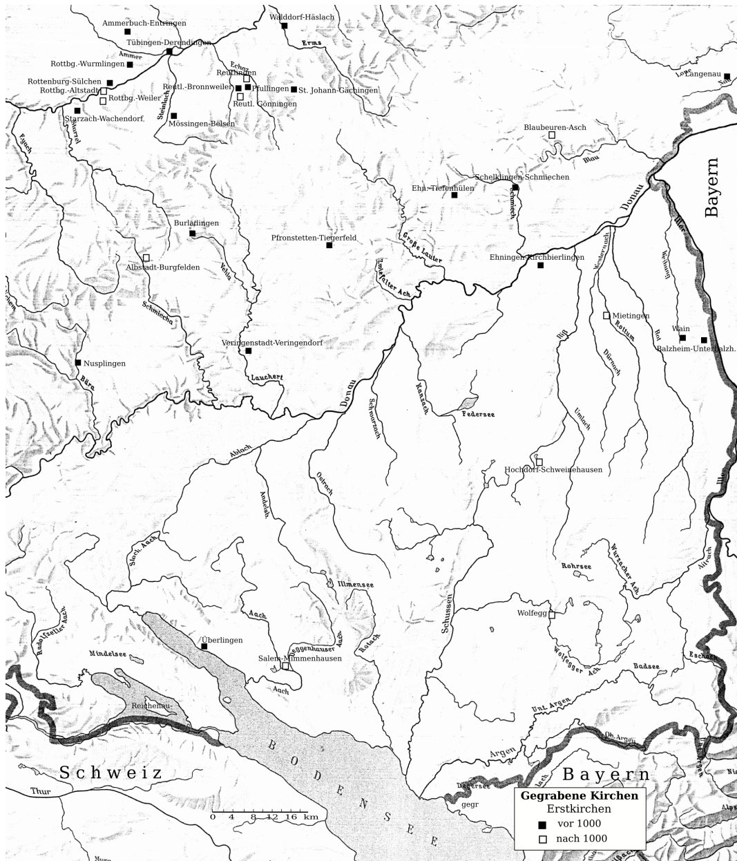
Abb. 51 Umfangreiche Grabungen in Kirchen (Siehe Tabelle 2 letzte Zeile)