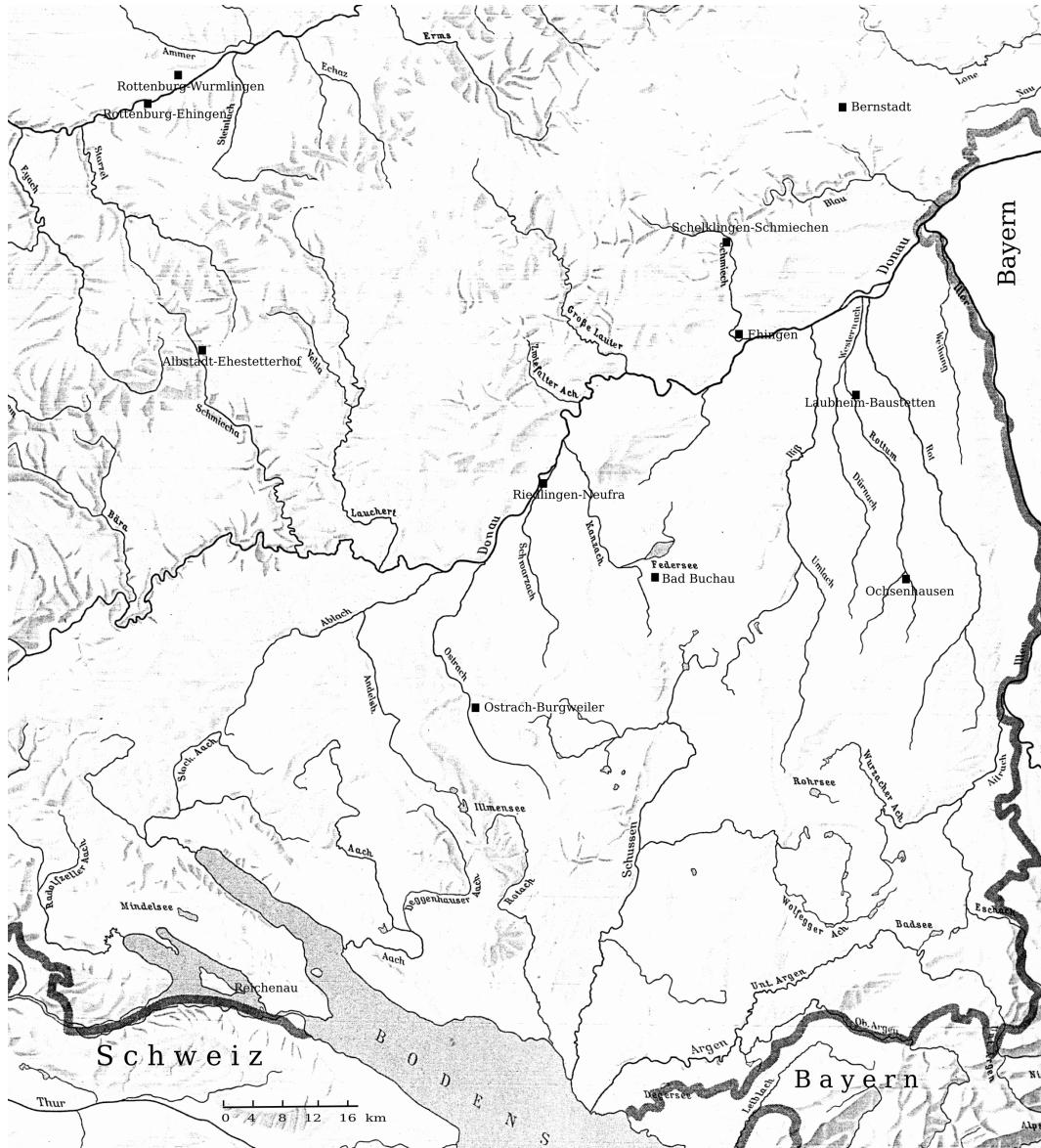
Abb. 53 Kirchen mit Krypta (Tabelle 2)