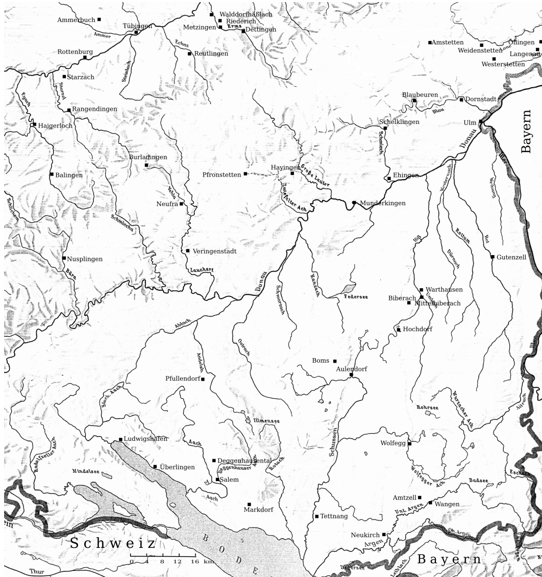
Abb. 56 Erstnennungen von Kirchen (Tabelle 5)