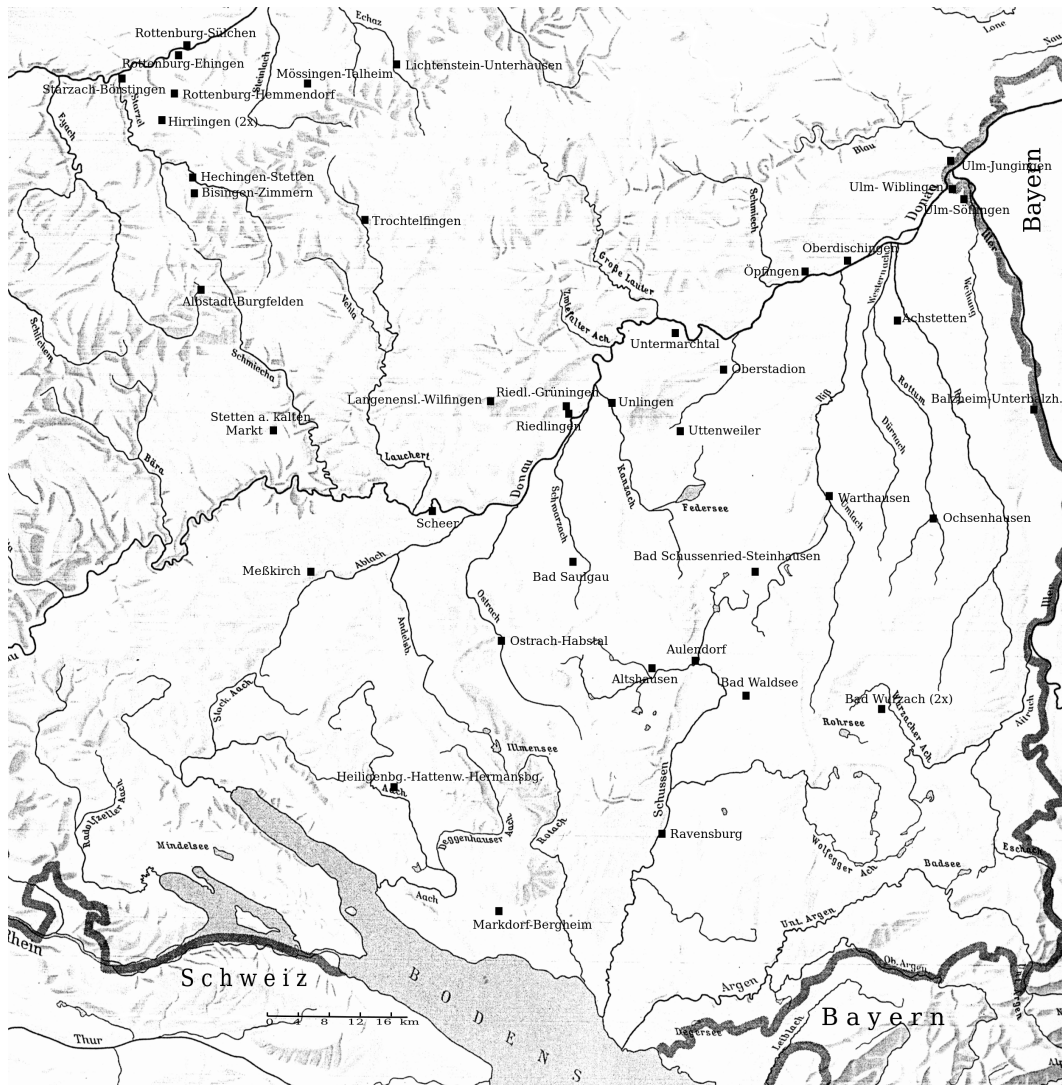
Abb. 54 Kirchen mit Gruft (Tabelle 3)