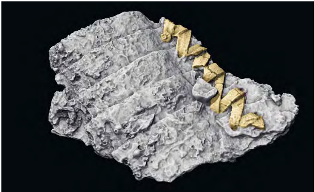
ABB. 3 Horrheim, Gem. Vaihingen a. d. Enz, Grab 23. Hochpräziser Streifenlichtscan einer Gruppe zusammengehöriger Lamellen des Panzers. Der die einzelnen Eisenlamellen verbindende Lederriemen war noch erhalten und ist hier hellbraun eingefärbt.

Bei den beiden großen, besonders tief eingegrabenen Gräbern 15 und 23, die beide starke Beraubungsspuren zeigten, handelt es sich nach Ausweis der überlieferten Beigaben um Männergräber. Auffällig sind die besonders großen Körperhöhen der in den beiden genannten Gräbern Bestatteten. Im Bereich der Grube von Grab 15 konnten zwei Raubschächte beobachtet werden.