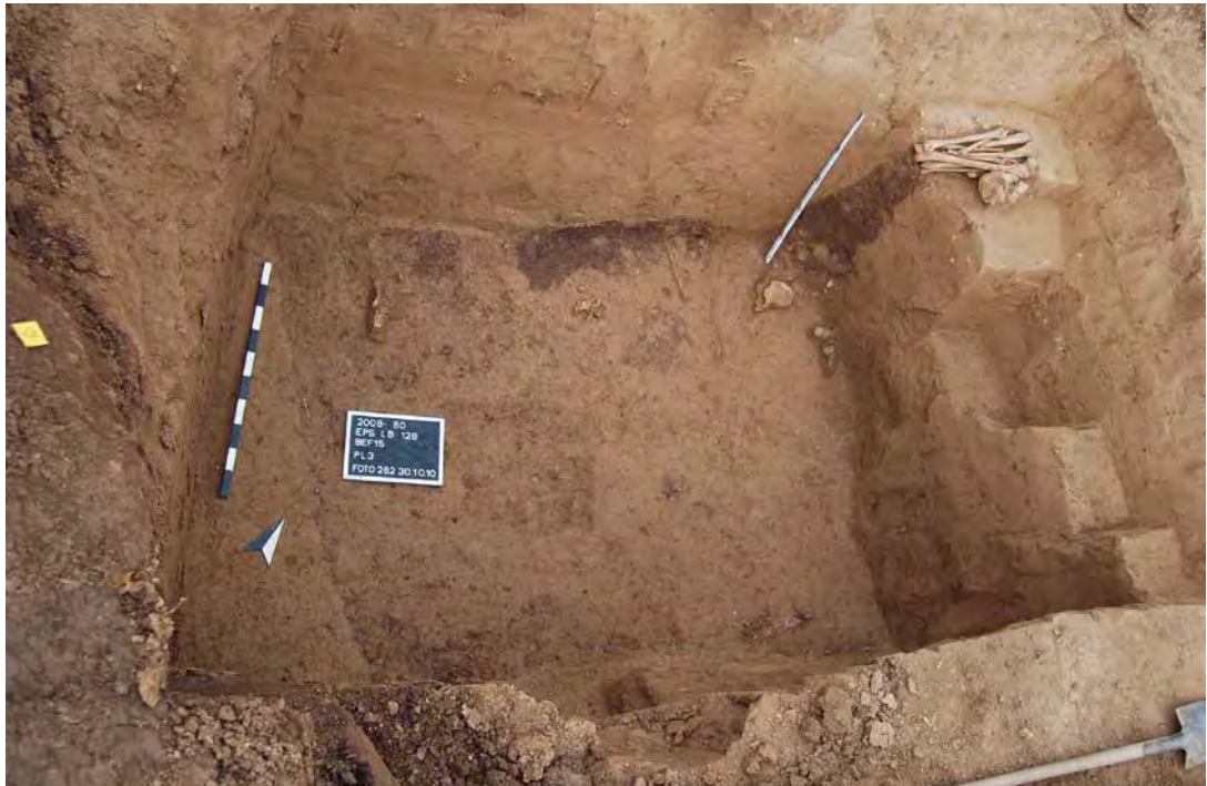
ABB. 2 Horrheim, Gem. Vaihingen a. d. Enz, Grab 15: Oberhalb der Grabsohle fanden sich am Rand die Extremitätenknochen regelrecht gestapelt.