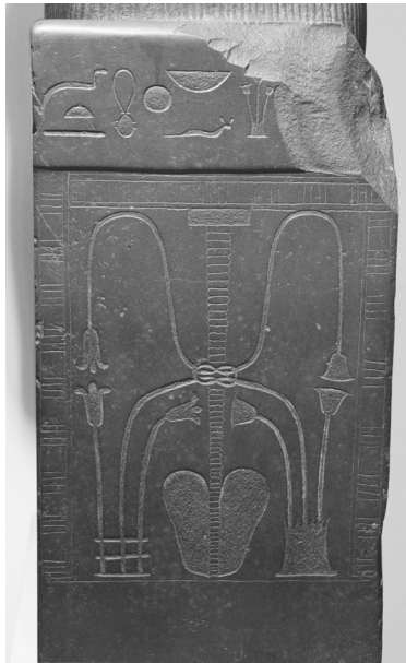
Abbildung 15: Relief der Vereinigung der beiden Länder auf einer Sitzstatue Sesostris' I.

pharaonischer Tradition als Herrin der beiden Länder dargestellt worden. 1206 Dafür würde auch sprechen, dass Sabina mit diesem Titel auch auf dem Antinoos-Obelisken bezeichnet wird, auf dem die Vergöttlichung des Antinoos beschrieben wird (siehe unten). Dort lautet ihr Titel hm.t nsw.t wr.t und hnw.t t3.wj , was „Große Königliche Gemahlin“ und „Herrin der beiden Länder“ bedeutet – beides sind seit pharaonischer Zeit belegte Titel für die (Haupt-)Ehefrauen ägyptischer Könige. 1207 Die Ikonographie des runden Attributs auf Sabinas Porträt entspricht jedoch nicht der Art, wie diese Verbindung der beiden Länder in der ägyptischen Kultur dargestellt wurde, die zudem stets noch die beiden Pflanzenstiele von Lotos und Papyrus beinhaltete (Abbildung 15).