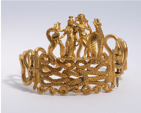
Abbildung 16: Armreif mit Agathos Daimon, Isis-Tyche, Aphrodite und Thermouthis.

überliefert ist, erschließt sich nicht, wie darin das runde Attribut auf Sabinas Münzen erkannt werden soll. 1208