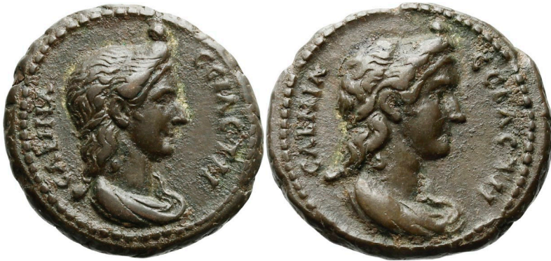
Abbildung 17: Averse der Exemplare HCR26395 (links) und HCR26396 (rechts).

Ein anderer zu diskutierender Fall ist der Revers des Typs RPC III 5926. Der Avers zeigt Sabina mit hochgesteckten Haaren sowie der Legende CABEINA CEBACTH. Auf dem Revers ist eine nach links sitzende Frauenfigur zu sehen, die ein Zepter in ihrem linken Arm sowie ein Sistrum in ihrer ausgestreckten rechten Hand hält. Eine deskriptive Legende ist nicht vorhanden, lediglich links und rechts im Feld die Angabe des Regierungsjahres. Durch das Sistrum ist eine Identifikation der Dargestellten als Isis möglich. Der Typ ist nur in einem Exemplar belegt, das sich in Turin befindet (Abbildung 18 und Abbildung 19). 1210