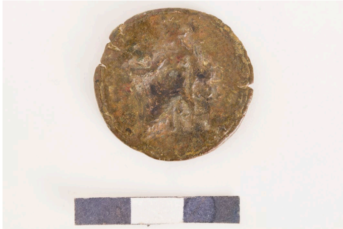
Abbildung 19: RPC III 5926, Revers.