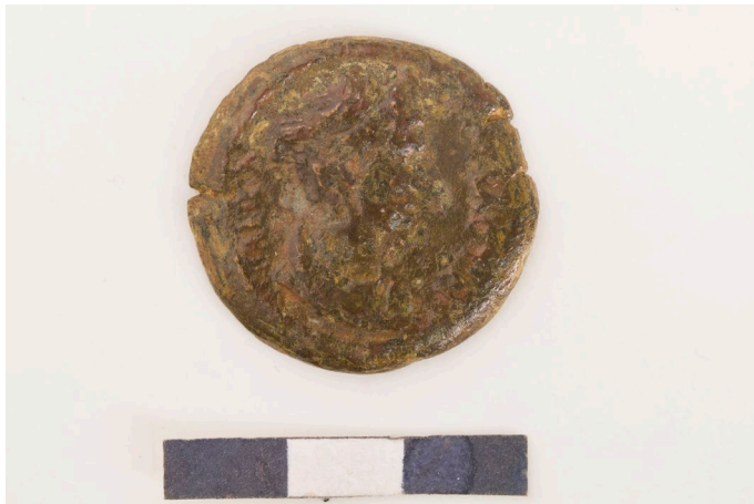
Abbildung 18: RPC III 5926, Avers.

Ein anderer zu diskutierender Fall ist der Revers des Typs RPC III 5926. Der Avers zeigt Sabina mit hochgesteckten Haaren sowie der Legende CABEINA CEBACTH. Auf dem Revers ist eine nach links sitzende Frauenfigur zu sehen, die ein Zepter in ihrem linken Arm sowie ein Sistrum in ihrer ausgestreckten rechten Hand hält. Eine deskriptive Legende ist nicht vorhanden, lediglich links und rechts im Feld die Angabe des Regierungsjahres. Durch das Sistrum ist eine Identifikation der Dargestellten als Isis möglich. Der Typ ist nur in einem Exemplar belegt, das sich in Turin befindet (Abbildung 18 und Abbildung 19). 1210