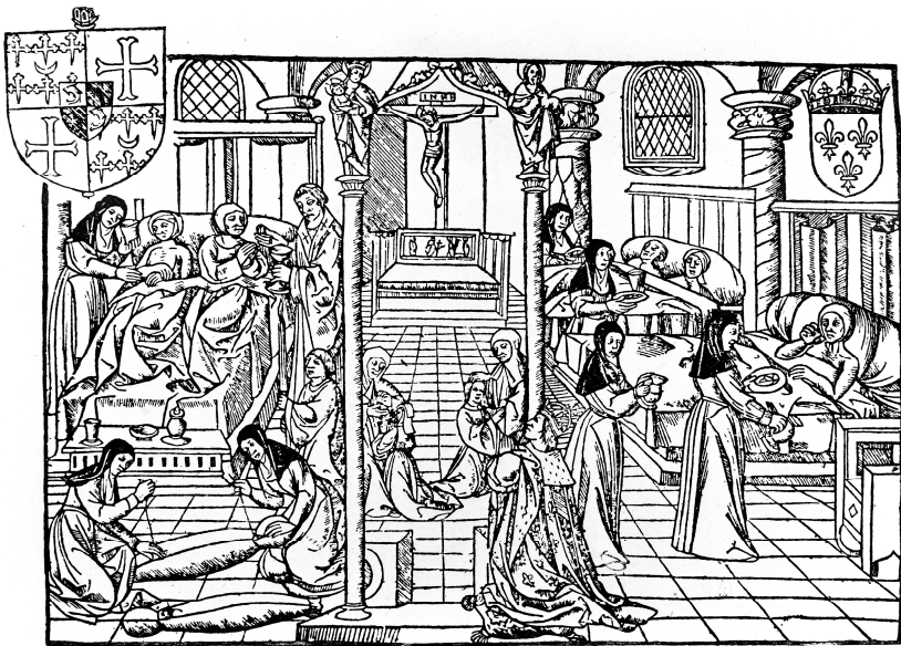
Abbildung 2: Pariser Spital um 1500