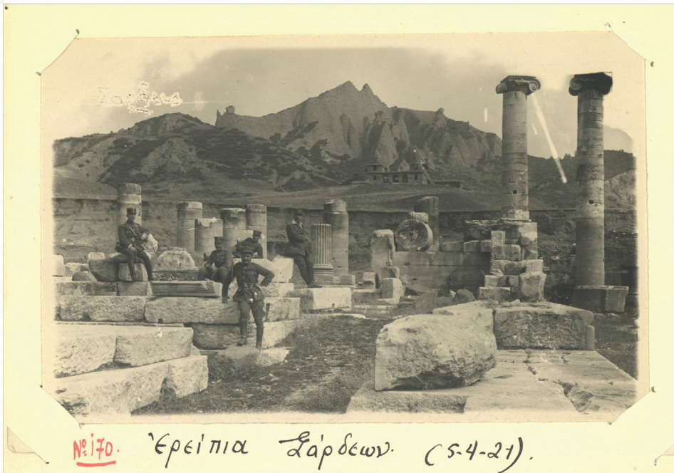
Εικόνα 1: Έλληνες αξιωματικοί στα ερείπια των Σάρδεων κατά τη διάρκεια της Μικρασιατικής εκστρατείας, Απρίλιος 1921.

ενός έθνους (Díaz-Andreu 2007). Έτσι συχνά χρησιμοποιήθηκε στο παρελθόν ως μέσο για εθνικές διεκδικήσεις χαμένων ή νεοαποκτηθέντων εδαφών (Díaz-Andreu και Champion 1996, 19). Χαρακτηριστικό παράδειγμα αποτελεί η δυτική Ανατολία, όπου μετά την υπογραφή της Συνθήκης των Σεβρών το 1920 ξεκίνησαν ανασκαφές στην περιοχή υπό την σκέπη της Αρχαιολογικής Εταιρείας Αθηνών, με στόχο την ανεύρεση αρχαιολογικών τεκμηρίων του Ιωνικού Αποικισμού, που θα νομιμοποιούσαν τον ελληνικό έλεγχο της περιοχής.