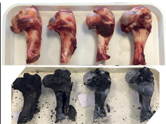
Εικόνα 4: Πειραματική Αρχαιολογία. Σαρκωμένα βραχιόνια οστά χοίρου πριν και μετά την καύση, πείραμα που διεξήχθη σε κλειστό κλίβανο με σκοπό να καταγράψει πώς αλλοιώνονται τα σαρκωμένα μέρη του σώματος κατά τη διάρκεια σύντομων επεισοδίων καύσης αλλά σε υψηλές θερμοκρασίες.

και του χρόνου σχηματισμού των διαδοχικών στρωμάτων επιχώσεων που αναπτύσσονται καθ' ύψος και κατά πλάτος μίας θέσης, έχουμε συμμάχους τις γεωλόγους και τις μικρομορφολόγους (βλ. Karkanas και Goldberg, 2019). Έτσι, οι παρατηρήσεις στη μεγακλίμακα συνδυάζονται με τη μικροσκοπία και την ερμηνεία των οπτικών ιδιοτήτων των υλικών για να παράγουν μία αναλυτικότερη εικόνα των αποθετικών και μεταποθετικών διαδικασιών 12 . Επιπλέον, οι πληροφορίες που περιλαμβάνουν οι ίδιες οι επιχώσεις 13 που περικλείουν την αρχαιολογική μαρτυρία, καθώς και η σημασία της κατανομής τους έχουν αυξήσει σημαντικά τον όγκο του χώματος που συλλέγεται και μελετάται κατά τη διάρκεια των ανασκαφών. Τέλος, τα εμπειρικά συμπεράσματα σε σχέση με τη συμπεριφορά διαφόρων υλικών υπό συγκεκριμένες συνθήκες καθώς και η εφαρμοσιμότητα ορισμένων πρακτικών, είναι δυνατόν να ελέγχονται πειραματικά (Εικόνα 4, Karkanas, 2021; Chatzikonstantinou, 2022).