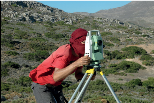
Εικόνα 1: Έρευνες Πεδίου. Τοπογράφηση με τη χρήση Total Station, λήψη από τη θέση Χοιρόμανδρες Ζάκρου (Κρήτη) στο πλαίσιο συστηματικών εργασιών του ερευνητικού προγράμματος «Μινωικοί Δρόμοι».

Η αρχιτεκτονική, η διαρρύθμιση δηλαδή του χώρου και η μεταβολή του φυσικού τοπίου σε ανθρωπογενές κατασκεύασμα με σκοπό την κατοίκηση, τη λατρεία, την παραγωγή/επεξεργασία, την εδραίωση αντιλήψεων κ.ο.κ, αποτελούν ένα ακόμη θεμελιώδες πεδίο της έρευνας. Πρόκειται για μία ειδική κατηγορία, η οποία μελετάται πρωτίστως στο πεδίο. Οι κύριες τεχνικές τεκμηρίωσης και μελέτης θεωρούνταν αυτονοήτως γνωστές στην αρχαιολόγο (Εικόνα 1) 10 .