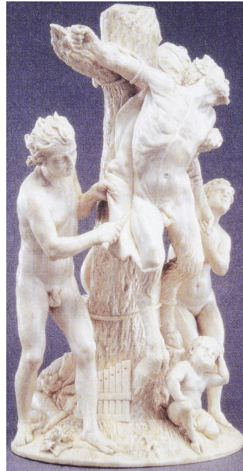
Abb. 2 Apoll schindet Marsyas. Adam Lenkhardt, Elfenbein 1644 (aus [9]).

entstellt wurde. Wer immer die Flöte aufhebe, sollte schwer bestraft werden. Der Satyr Marsyas hob die Flöte trotz Warnung auf und spielte meisterhaft. Ehrgeizig forderte er den Leier spielenden Gott Apollo zum Wettstreit – und verliert. Der Sieger dürfe mit dem Besiegten verfahren, wie er wolle. Auf Hautabziehen hatte man sich geeinigt. Also hängte Apollo den klagenden Marsyas an einen Baum und zog ihm bei lebendigem Leib die ganze Haut ab (Abb. 2). „Er war nur eine Wunde“, heißt es bei Ovid. Das Häuten oder Schinden war eine Strafe mit Leiden, Todesfolge und Verlust der Person und zudem ist es eine Warnung vor Überheblichkeit gegenüber Göttern und Herrschern. Marsyas gilt als Metapher in Richtung Unterdrückung und Beherrschung des Menschen durch allmächtige Dominanz und Symbol für die Aufgabe der eigenen Gestalt und damit der Individualität. Das Schinden des Marsyas und anderer Märtyrer zieht sich durch die Jahrhunderte künstlerischer Darstellung [9] und findet sich in allen anthropologischen Reflexionen über Dominanz auf der einen und Selbstaufgabe auf der anderen