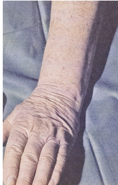
Abb. 3 Vorzeitige und lichtbedingte, bizarre Alterung der Haut: grobe Faltung am Handrücken und Fleckung des Unterarms.

Der moderne fast fanatische Sonnenkult führt zur enormen Zunahme von lichtinduzierten Hautkarzinomen und zur vorzeitigen Hautalterung.