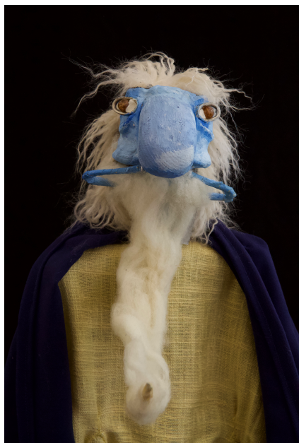
Oben: Das Fräulein (Monolog 2), Der kriegsverstümmelte (Monolog 3) Unten: Der blühende Kirschzweig, Der alte Mann (beide aus Das Grün und das Gelb ).