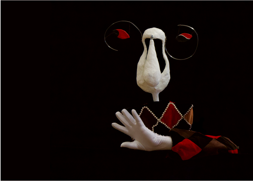
Kasper (Monolog 1)