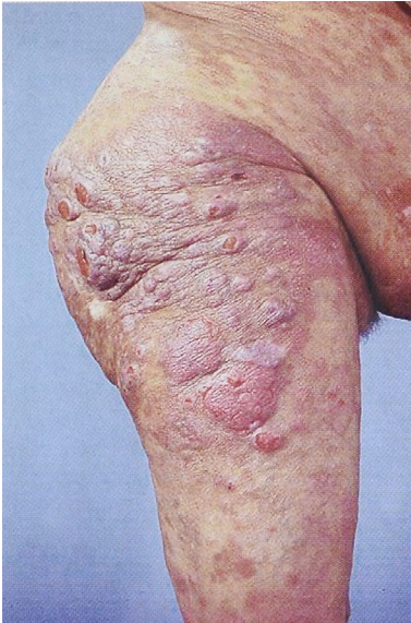
Abb. 2 Knotige Form der Mycosis fungoides am Bein als Vergleich zur Abb. 1.

Auch auf dem Gemälde „Enttäuschte Seele“ von Ferdinand Hodler 1889 wird zur Verstärkung von Alter als Fluch, von Vergänglichkeit und von Resignation noch zusätzlich zu diesen Merkmalen eine knotige Hauterkrankung dargestellt, die als „Facies leontina“ imponiert und recht typisch ist für die Mycosis fungoides im Gesicht. Das Bild hängt im Kunstmuseum Basel, die Deutung stammt vom Autor [10].