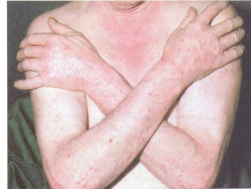
Abb. 8 Neurodermitis atopica, in Frankreich Prurigo Besnier genannt, in Erinnerung an den Pariser Dermatologen E. Besnier, 1904 in Berlin der internationale Ehrenpräsident.

Diese hohe Zeit der Ernte [3] ging zusammen mit einer gewichtigen Steigerung der Reputation der Dermatologie in Deutschland und Europa. Dies alles zerbrach und ging verloren durch die politisch getriebene Elimination der jüdischen Fachkollegen in Forschung, Lehre und Patientenversorgung und durch die Isolation während des 2. Weltkrieges.