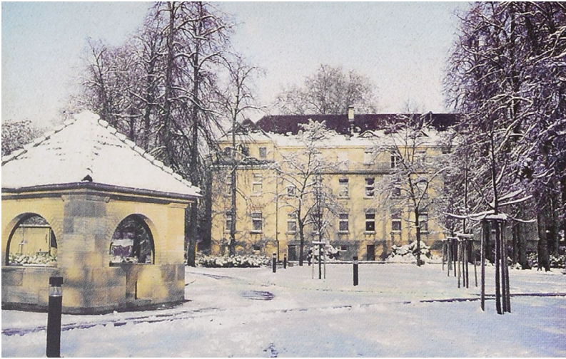
Abb. 1 Die 80-jährigen Gebäude der Universitätsklinik für Dermatologie und Allergologie in Mannheim (Teil der Universität Heidelberg).

1904 gibt es schon über 20 städtische Hautkliniken, so seit 1901 in Mannheim (Abb. 1), wo ich wirkte, oder in Minden seit 1904, wo wir eben die 100 Jahre feiern.