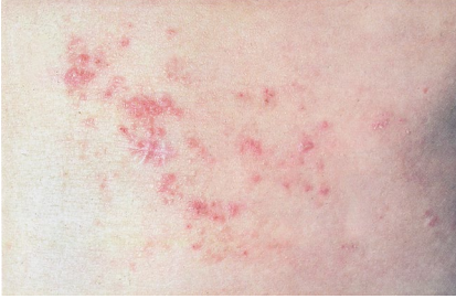
Abb. 7 Segmentäre Dyskeratosis follicularis, Morbus Darier genannt und erstbeschrieben 1889 von Ferdinand Jean Darier, dem französischen Gastreferenten 1904 in Berlin, die Elemente sind aufgereiht entlang der Blaschkolinien (vergleiche Abb. 5).