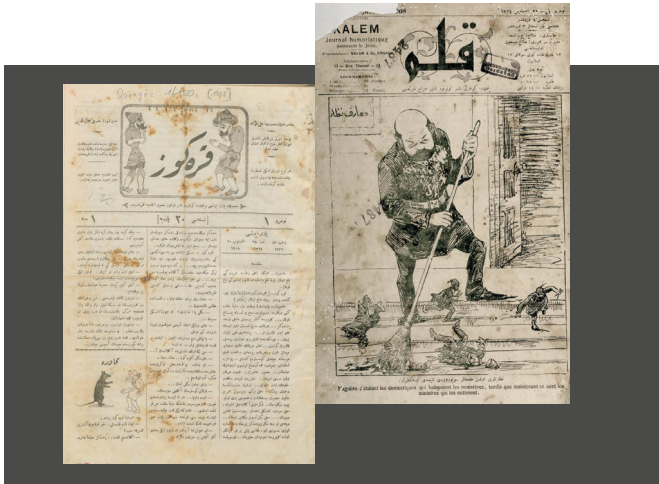
Links: Titelseite der ersten Ausgabe von Karagöz („Schwarzauge“), 10.8.1908. Rechts: Titelseite der ersten Ausgabe von Kalem („Stift“), 3.9.1908. Die Zeitschrift ist durchgängig zweisprachig auf Osmanisch-Türkisch und Französisch erschienen.