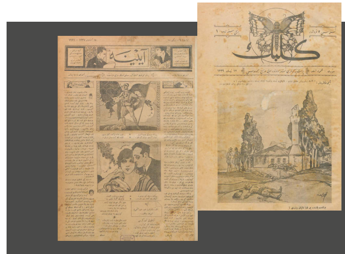
Links: Titelblatt der ersten Ausgabe von Ayine („Spiegel“), 18.8.1921. Rechts: Titelblatt der ersten Ausgabe von Kelebek („Schmetterling“), 12.4.1923.

There was also an increase in the number of satirical magazines in the 1920s. Particularly during the Turkish War of Independence (1921–1922) and the years that followed during the founding period of the Turkish Republic, numerous magazines appeared that were dedicated to political and social issues and provide us with information about the discourses of the time.