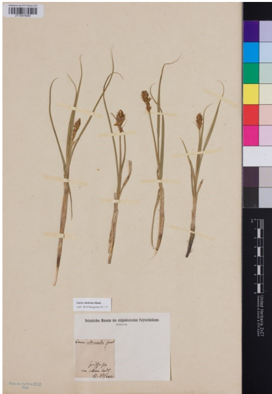
Abb. 2: Carex disticha Huds., ZT-00079984