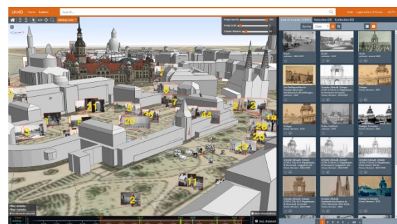
Abb. 1: Interface des 4D-Browsers, einer interaktiven Webanwendung zur Forschung mit Bildern

FotografInnen, virtuell verortet. Eine in die Webanwendung integrierte Zeitleiste ermöglicht zudem die Nachempfindung der Veränderungen im fotografischen Abbild der Stadt über die Zeit hinweg.