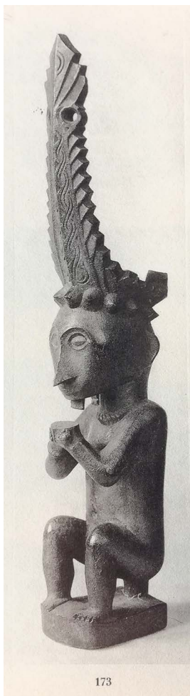
50 De gauche à droite : Statuette de Nouvelle-Guinée et Adu Zatua, Sculptures d'Afrique, d'Amérique et d'Océanie. Collection André Breton et Paul Éluard, s.n., cat. de vente, Paris, Hôtel Drouot, 1931, planche IV, fig. 93 ; planche XVII, fig. 173

correspond au lot numéro 259 et elle est décrite comme une « statuette en bois sculptée, teinte ocre ; elle représente une divinité à long nez en bec, la tête pointue surmontée d'une haute coiffure », mesurant 23 centimètres de haut et provenant de Nouvelle-Guinée. C'est au moment de la vente Bondy que le fétiche du Sepik rejoint l' Adu Zatua dans la collection de Breton, pour la somme de 1 120 francs hors frais 12 . Ce dernier se porte également acquéreur de quatre autres lots provenant de Nouvelle Guinée : deux autres statuettes, des oreillers en bois sculpté et un dard à deux pointes, pour un total de 6 750 francs 13 .