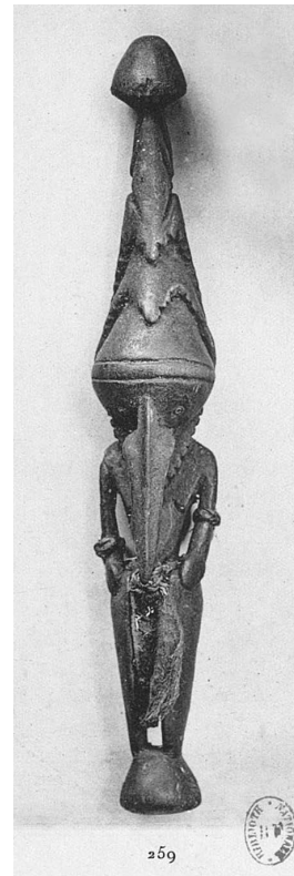
49 Statuette de Nouvelle-Guinée, Collection Walter Bondy. Céramique Chinoise, Han, Tang, Song, Yuen, Ming, Kanghi, Kienlong, et alli., s.n., cat. de vente, Paris, Hôtel Drouot, 1928, planche XII, fig. 259

pas la date d'acquisition de « l'oiseau-totem », mais celui-ci apparaît dans la vente que fit Walter Bondy d'une très grande partie de sa collection, du 9 au 11 mai 1928, à l'Hôtel Drouot 10 . Sur près de 500 lots issus de l'Asie, de l'Afrique et de l'Amérique, 68 proviennent d'Océanie dont 39 de Nouvelle-Guinée. Au cours de cet événement, les premiers records de prix sont atteints pour l'art océanien avec, notamment, une tête humaine de l'île de Pâques adjugée 15 000 francs hors frais, et une statue Ouli [Uli] de Nouveau Mecklembourg [Nouvelle-Irlande] qui atteint la somme de 18 000 francs 11 . Reproduite au catalogue (fig. 49), la création du Sepik