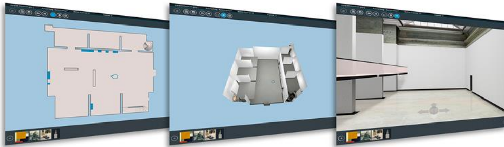
Abb.1: Die drei Bearbeitungsansichten von cura3D museum pro

KURZDARSTELLUNG: Digitalisierung bedeutet für Ausstellungshäuser vor allem, große Bestände an Exponatsdaten zu erzeugen und zu verwalten. Digitalisierung wirft aber auch die Frage auf, in welcher Weise sich dieser Datenbestand in Zukunft sinnvoll verwenden lässt. Eine bislang wenig genutzte Möglichkeit bietet die interaktive Planung von Ausstellungen und Depots – auf Basis der bereits erhobenen Daten. Dabei stellen sich einige Herausforderungen. Wie lässt sich beispielsweise der Medienbruch zwischen realer Ausstellung und ihrem virtuellen Planungspendant optimal verorten? Anhand der Planungslösungen cura3D museum pro und depot pro wird gezeigt, wie dies in der Praxis aussehen kann.