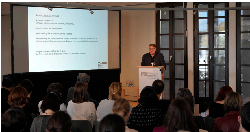
State of the Art Archives, Berlin 2017, Günter Herzog

Das ZADIK – Zentralarchiv für deutsche und internationale Kunstmarktforschung e. V. ist das weltweit einzige Spezialarchiv zur Geschichte des Kunstmarkts. 1992 wurde es als Zentralarchiv des deutschen und internationalen Kunsthandels vom Bundesverband Deutscher Galerien und Kunsthändler BVDG gegründet. Seit 2001 arbeitet es in Kooperation mit der SK Stiftung Kultur der Sparkasse KölnBonn, seit Ende 2014 ist es Forschungsarchiv an der Universität zu Köln.