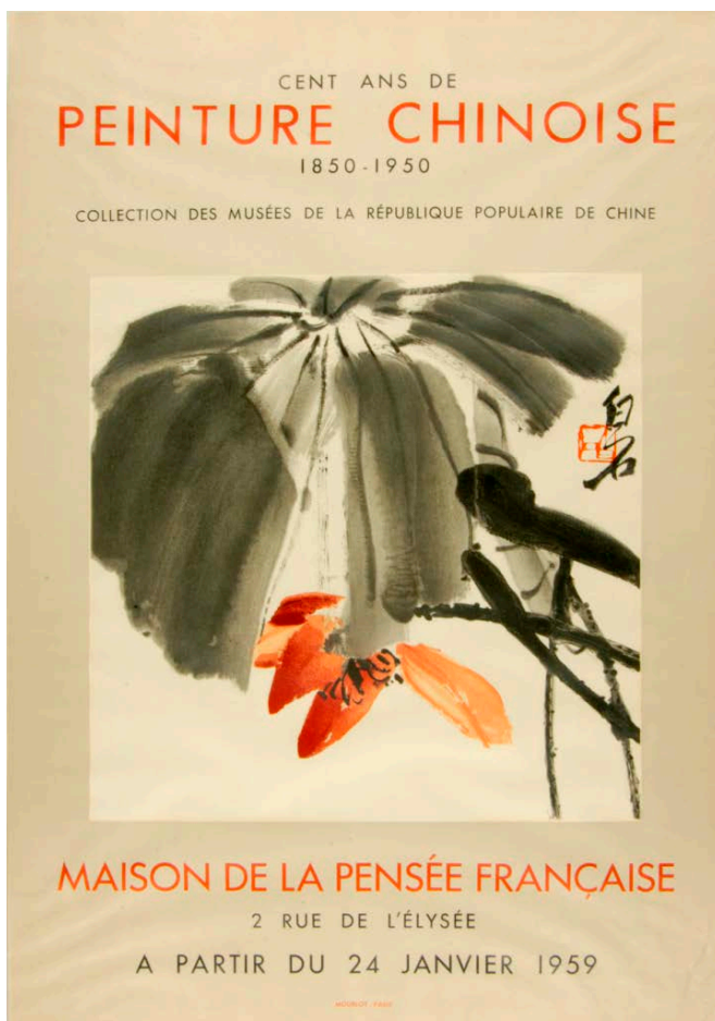
3 Affiche de l'exposition Cent ans de peinture chinoise, 1850-1950 , Collections des musées de la République Populaire de Chine, Maison de la pensée française, Paris, janvier-février 1959