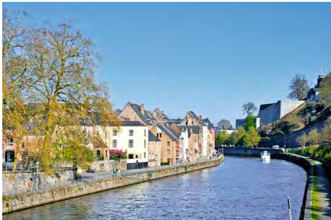
Fig. 5: Namur, la rue des Brasseurs aujourd'hui, du côté de la Sambre, au pied de la citadelle.

années 80. Le long processus d'intégration des consciences en matière de patrimoine et d'aménagement du territoire se traduit progressivement dans de nouvelles législations puis, à partir de 1989, dans la fusion des administrations elles-mêmes.