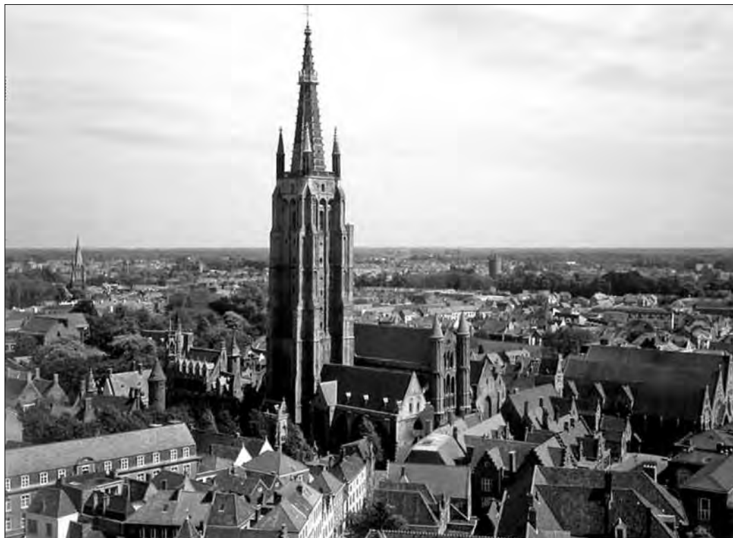
Fig. 2: Bruges, partie de la trame, de son profil et toitures

relâchement et le centre historique sera peu à peu confronté aux problèmes connus ailleurs comme par exemple les démolitions, l'exode urbain : 1000 maisons sont en mauvais état et la moitié est inhabitée. La trame urbaine avec ses canaux, rues et places typiques et son profil général reflètent encore son évolution historique, les immeubles-tours modernes étant bannis (fig. 2).