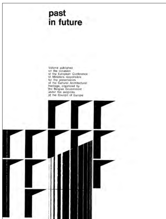
Fig. 3: Couverture de la publication éditée par la Belgique à l'occasion de la Conférence européenne des Ministres responsables du Patrimoine culturel , Liège, 1969

Les premières recherches théoriques et pratiques ont établi le diagnostic des problèmes touchant l'ensemble de la ville historique en tant que paysage urbain. Il contribuera à l'élaboration d'une philosophie globale et « organique », fondamentale pour ce plan. Pour concrétiser et nuancer les informations et expériences, des concertations régulières des habitants ont été prévues dès le début afin de recueillir leurs observations pertinentes basées sur la perception journalière de leur cadre de vie et leurs suggestions et solutions pour l'améliorer. La population entière a donc été mêlée à cette « aventure » inédite.