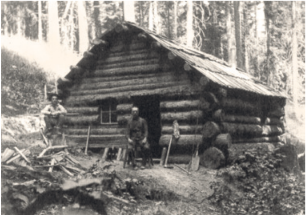
Abb. 1 Zwei ungenannte Kleinbauern vor einer Holzhütte in Idaho. Einer amerikanischen Redensart zufolge haben die Schweden das Blockhaus eingeführt.

Wachstum im Norden waren wichtige Anziehungspunkte. Dieses Gesetz leitete schwedische Einwander_innen nach Minnesota, das zum „Schwedenstaat Amerika“ wurde. Schwedische Siedlungen entstanden auch entlang der neuen Eisenbahnlinien, zum Beispiel in Rockford, Illinois. Der Arbeitsmarkt der Großstädte hatte armen Einwander_innen mehr zu bieten als die Landwirtschaftsgebiete. Viele von ihnen arbeiteten in der Baubranche. Es gibt eine Redensart, dass „die Schweden Chicago erbaut haben“ (Beijbom 1971).