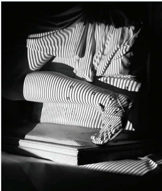
Figure 5 Scan des Fußes am Weimarer „Achilles“