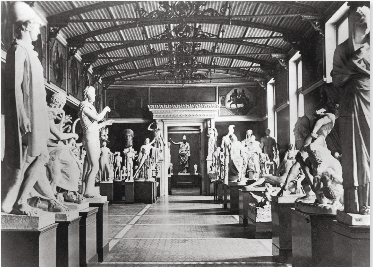
Figure 11 Der Niobiden-Saal im Neuen Museum, Berlin, 1877, Fotografie