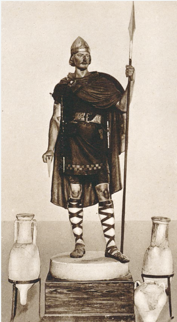
Figure 5 Gipsfigur der Rekonstruktion eines fränkischen (hier als germanisch interpretierten) Kriegers nach Ludwig Lindenschmit, Römisch-Germanisches Museum Haltern, um 1908, Postkarte

Auch in Sammlungen zeigt der Gips vielfältige Möglichkeiten: er kann dekoratives Objekt sein, einen festen Platz in einer thematischen oder chronologischen Reihe einnehmen, aber auch erläuterndes Medium in Sammlungen ganz anderer Ausrichtung sein Figure 5 . Gerade diese Flexibilität führte und führt häufig, wie nachfolgend zu zeigen ist, zum Niedergang von Gips-Sammlungen. 5