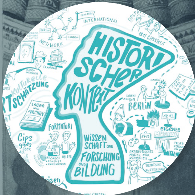
Graphic Recording s.302