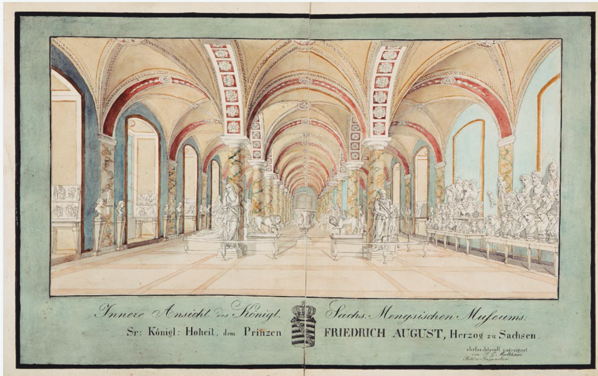
Figure 7 Dresden, Ansicht der Abguss-Halle mit den Gipsen aus der Mengsschen Sammlung, 1799

© SLUB Dresden/Deutsche Fotothek/Hans Reinecke 1988