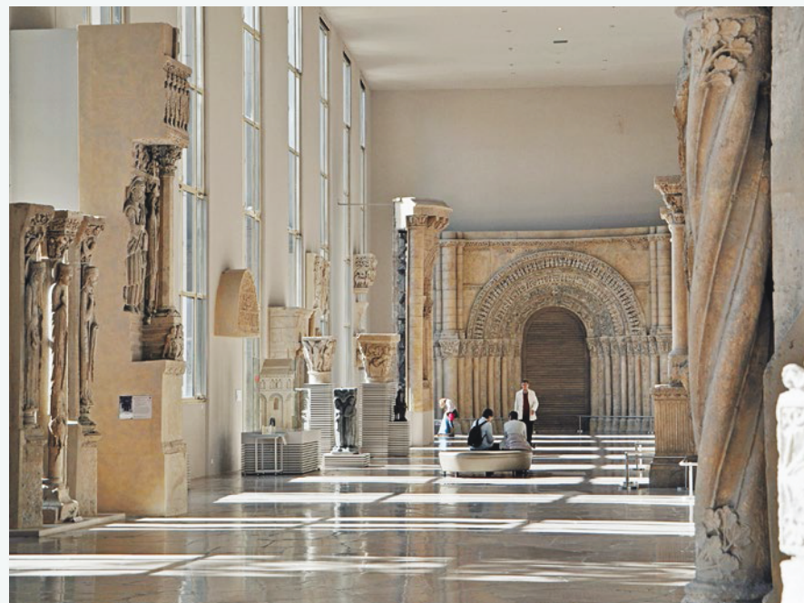
Figure 12 Cité de l'Architecture et du Patrimoine, Paris

Die Gleichförmigkeit der Sammlungen und die zunehmende Präsenz und Zugänglichkeit originaler Kunst durch Fotografie und Reisen beschleunigten den Niedergang der Gipsmuseen. Botho Gräfs Worte zur Eröffnung des Archäologischen Museums der Universität Jena im Jahr 1908 bringen eine neue, beinahe visionär zu nennende Sicht auf Gipsabgüsse zum Ausdruck: „Wenn wir uns aber einen Weltzustand denken, in welchem große Entfernungen spielend überwunden werden, so daß die über alle Welt verstreuten Originalskulpturen schnell und leicht erreichbar sind, so würde niemand mehr, einen Abguß der Nike von Samothrake oder des Mausolos zu sehen, ein Museum aufsuchen. Jedoch die Konfrontation verschiedener Kopien derselben Werke wird immer notwendig bleiben.“ 21