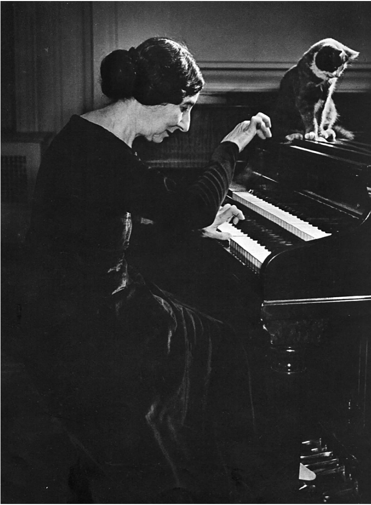
1 Wanda Landowska, par Philippe Halsman, Halsman Sight and Insight, New York, Doubleday, 1972

musicaux spoliés par le Sonderstab Musik , la cellule chargée de la confiscation des biens musicaux et de l'évincement des musiciens juifs de la vie musicale des pays occupés au sein de l'Einsatzstab Reichsleiter Rosenberg [Équipe d'intervention du Reichsleiter Rosenberg, ERR]. L'association recueille également les derniers témoignages directs ou indirects