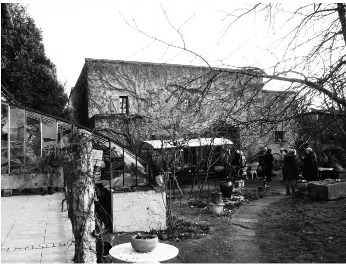
2 L’auditorium de Saint-Leu-la-Forêt aujourd’hui

Durant les années 1920, elle inaugure avec le pianiste Alfred Cortot (1877–1962) sa propre école de musique, le Temple de la Musique Ancienne, à Saint-Leu-la-Forêt (Val-d’Oise), et va même jusqu’à y faire construire un auditorium où se succéderont concerts et cours d’interprétation jusqu’en 1940 (fig. 2). Passionnée de musique, de littérature et d’organologie, Wanda Landowska a constitué une importante collection d’instruments anciens, et une bibliothèque de plus de 10 000 ouvrages qu’elle partage volontiers avec les étudiants et mélomanes du monde entier qui participent à ses cours d’interprétation et aux concerts qu’elle organise. Inspiratrice de nombreux compositeurs, Wanda Landowska sera la dédicataire du Concerto pour clavecin et cinq instruments solistes (1926) de Manuel de Falla et du Concert Champêtre (1928) de Francis Poulenc.