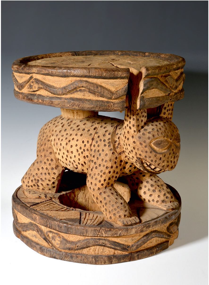
Abb. 31 | Stuhl, Westafrika, Kamerun, Grasland, Sammler: bislang unbekannt, Inv.-Nr. 5.967.