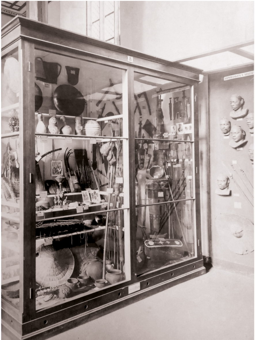
Abb. 28 | Afrika-Saal des Roemer-Museums um 1903, rechts im Bild an der Wand sind einige der Stuhlmannschen Abformungen zu sehen.