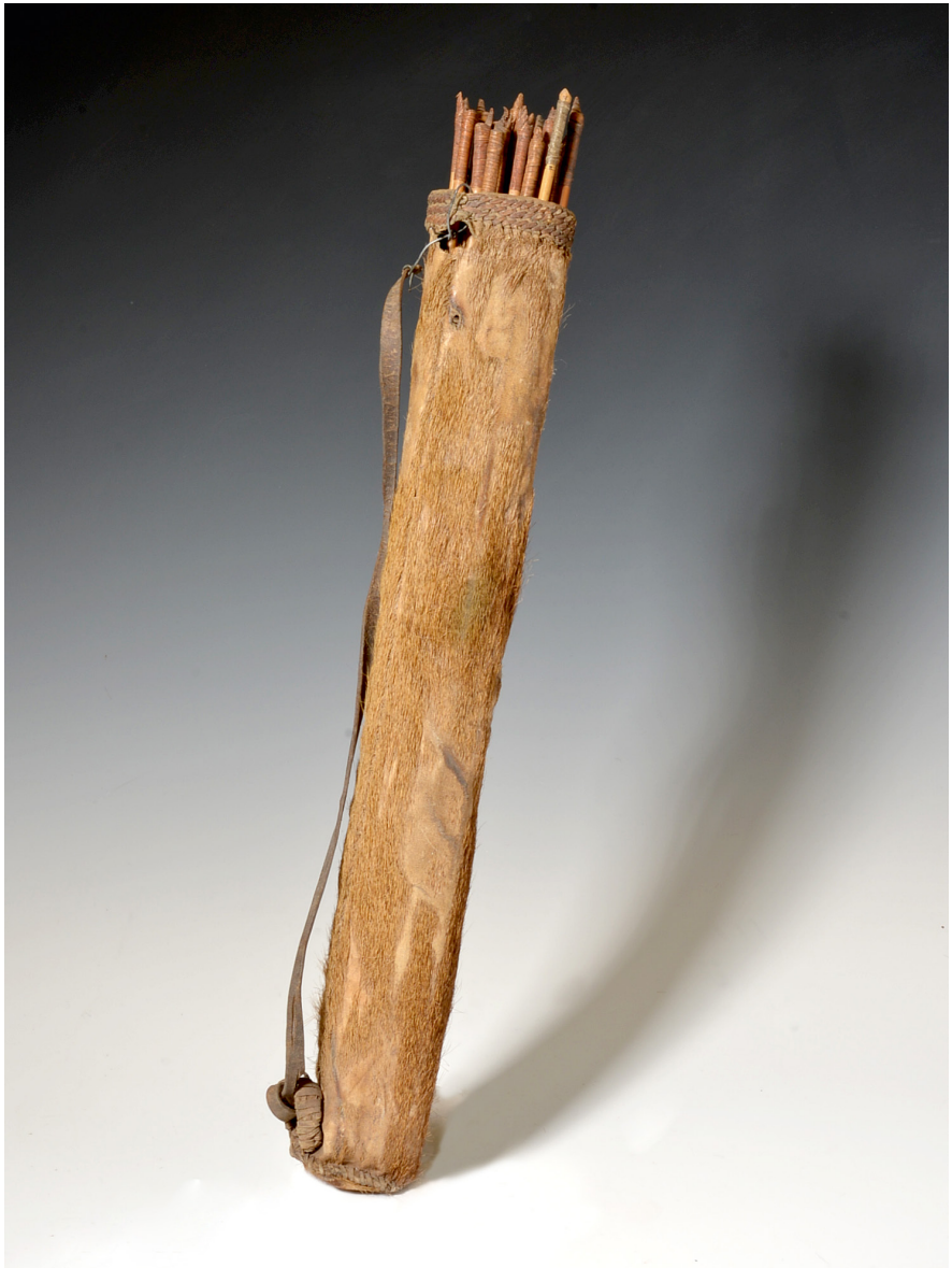
Abb. 15 | Köcher mit Pfeilen, Westafrika, Togo, Kabure oder Bassari, Sammler: Valentin von Massow, Inv.-Nr. V1.874 a.–af.