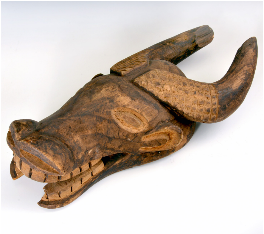
Abb. 30 | Aufsatzmaske „Büffel“, Westafrika, Kamerun, Grasland, Sammler: bislang unbekannt, Inv.-Nr. V5.965.

mehr gewesen sein als diejenigen, die im Inventarbuch explizit Glauning zugeordnet sind. Für die Objekte sind im Hildesheimer Inventarbuch entweder überhaupt keine Berliner Nummern eingetragen oder, in wenigen Fällen, Sammlernummern. Das macht eine Zuordnung der meisten Stücke zu einzelnen Sammlern nahezu unmöglich. Ausnahmen sind die Mütze V 5.990 aus „Lagos, Bonni“, der Korb mit Deckel V 6.089 a. b. aus „Bonni, Nigeria“, der geflochtene Fächer („Bonni! Yoruba“ 51 ) V 6.090 sowie das Opfermesser/ Haumesser V 6.099 aus dem Kongogebiet, bei denen sämtlich vermerkt ist, sie stammten aus der Sammlung Wassy Langheld (zu dieser siehe oben). Zu all diesen Gegenständen findet sich im Inventarbuch jeweils eine Sammlernummer, z. B. L. 135 für den geflochtenen Fächer. Anhand dieser Nummern