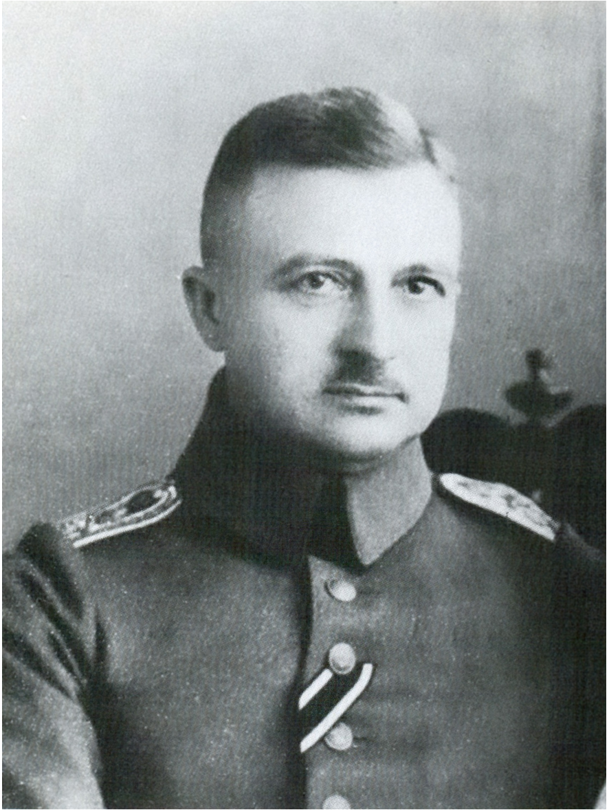
Abb. 16 | Julius Smend. Datum der Aufnahme unbekannt (aus Strehlau 1978, ohne Seitenzahl).