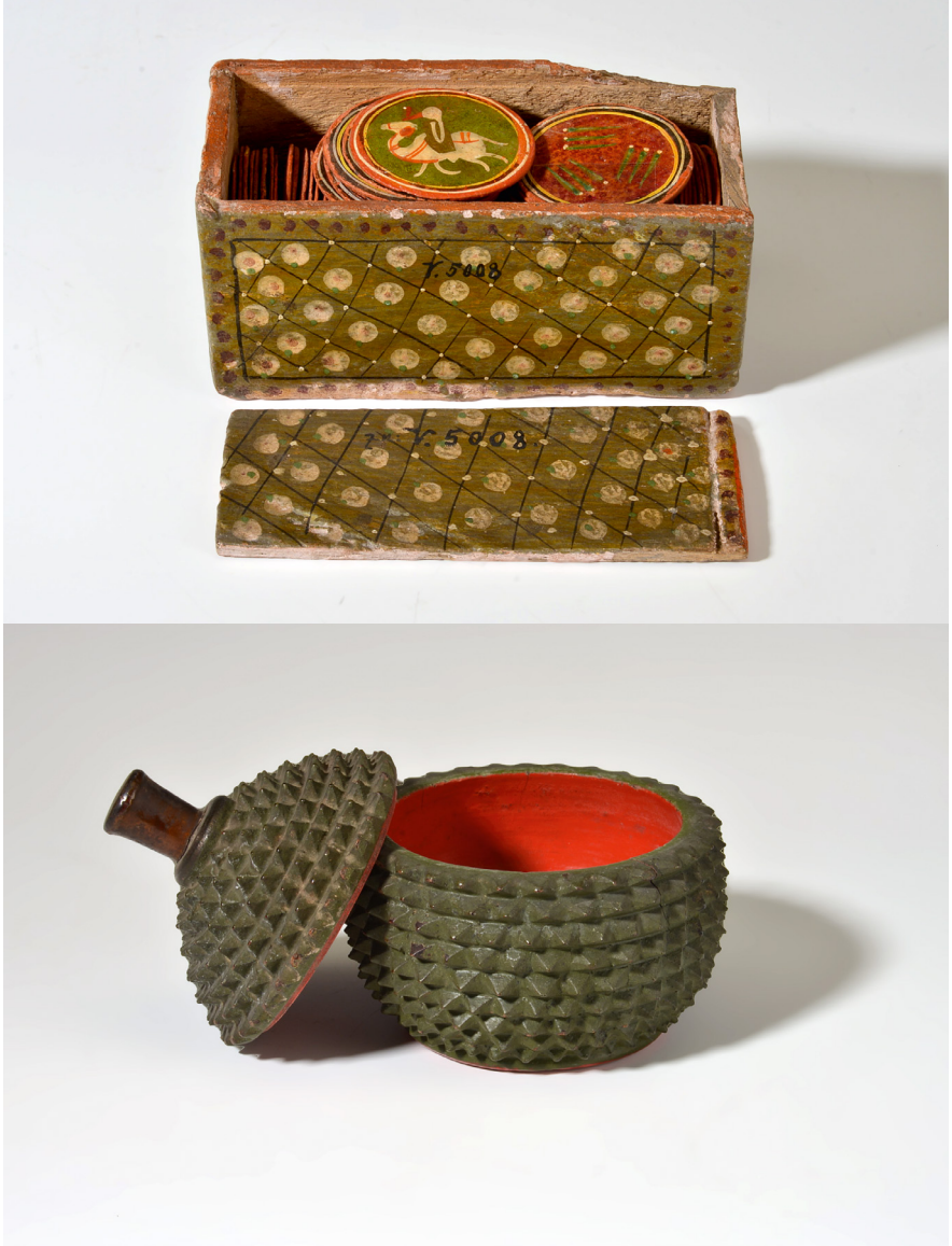
Abb. 12 | Lackkästchen mit Spielmarken für das ganjifa -Spiel, Indien, Lucknow, Sammler: möglicherweise Emil Riebeck, Inv.-Nr. V5.008.