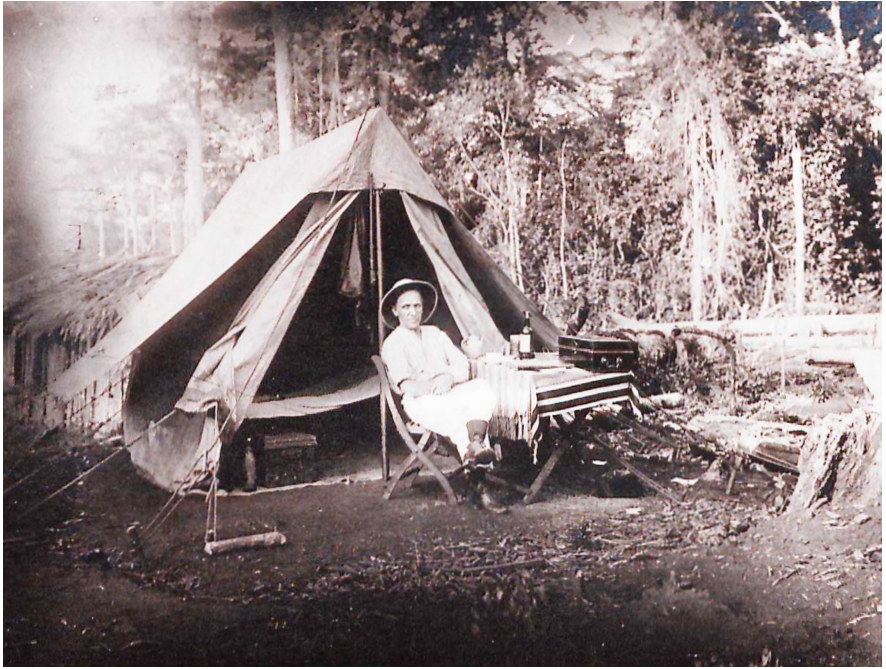
Abb. 23 | Wassy Langheld. Datum der Aufnahme unbekannt