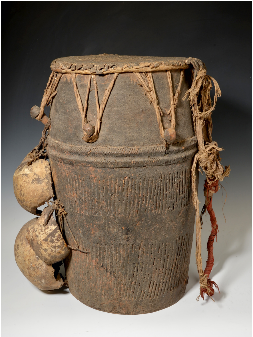
Abb. 17 | Kriegstrommel mit Schädeln, Westafrika, Togo, Ewe, Sammler: Julius Smend, Inv.-Nr. V1.856.