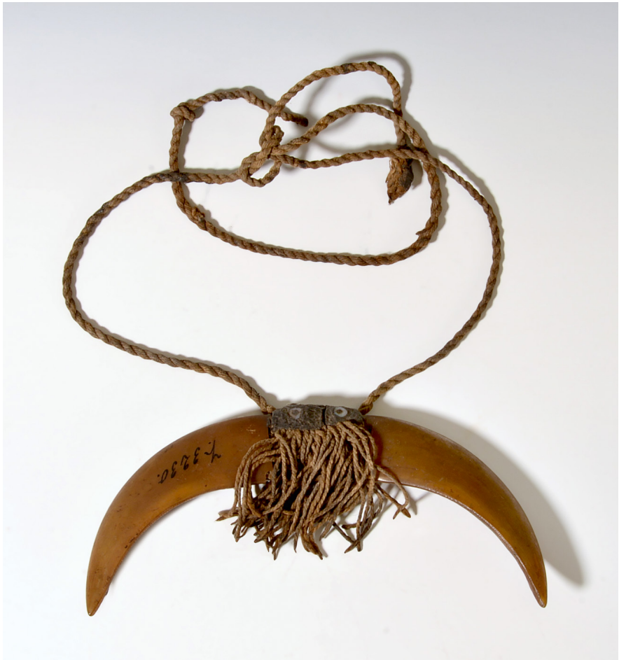
Abb. 10 | Brustschmuck aus Krallen des Riesengürteltiers, Bororó, Brasilien, Sammler: Karl von den Steinen, Inv.-Nr. V3.230.

Von den Bororó berichtet von den Steinen, sie seien im Hinblick auf ihre Tauschwünsche anspruchsvoller gewesen als die Ethnien am Kulisehu. Er schreibt: „Die guten Bororó waren derartig verwöhnt worden, dass wir mit unseren bescheidenen Tauschwaren übel ankamen. Sie waren bereits soweit Kenner, dass sie nur nordamerikanische Äxte wollten. Am meisten Anklang fanden noch unsere Perlen, allein auch hier erschienen die Frauen recht