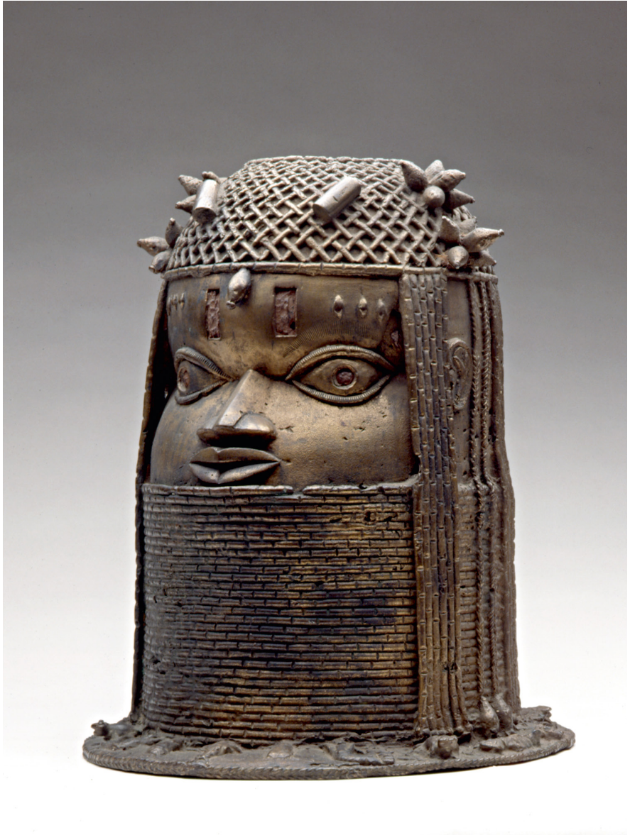
Abb. 22 | Gedenkkopf, Westafrika, Nigeria, Königreich Benin, Sammler: unbekannt, Inv.-Nr. V6.334.