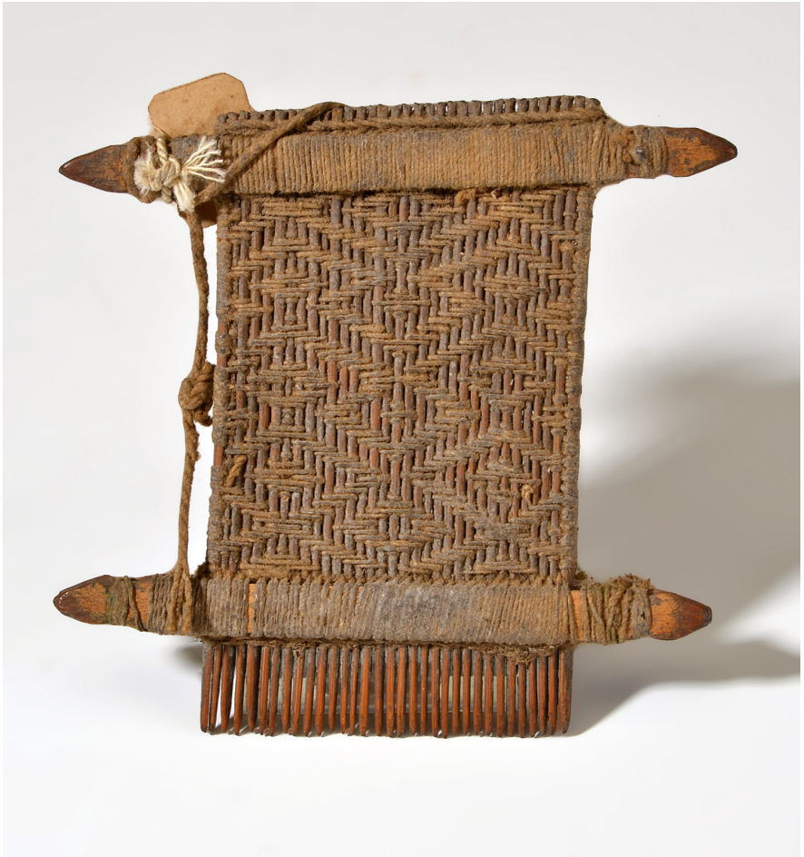
Abb. 9 | Kamm, Brasilien, Río Kulisehu, Bakaïri, Sammler: Karl von den Steinen, Inv.-Nr. V3.238.

Interesse in höchstem Grade fesselte, das überall vorhandene Wurfholz. (...) Offenbar diente die Waffe vorwiegend zum Tanz. Doch wurde uns angegeben, dass die Auetö und Trumaí sie im Kriegsfall gebrauchten“ (1894: 109). Bei den Yaulapiti erwähnt von den Steinen, dass sich dort „ein paar hübsche Spindelscheiben“ gefunden hätten, darunter sicher auch V3.232. Von den Trumaí stammt eine Fischkeule (V3.248).