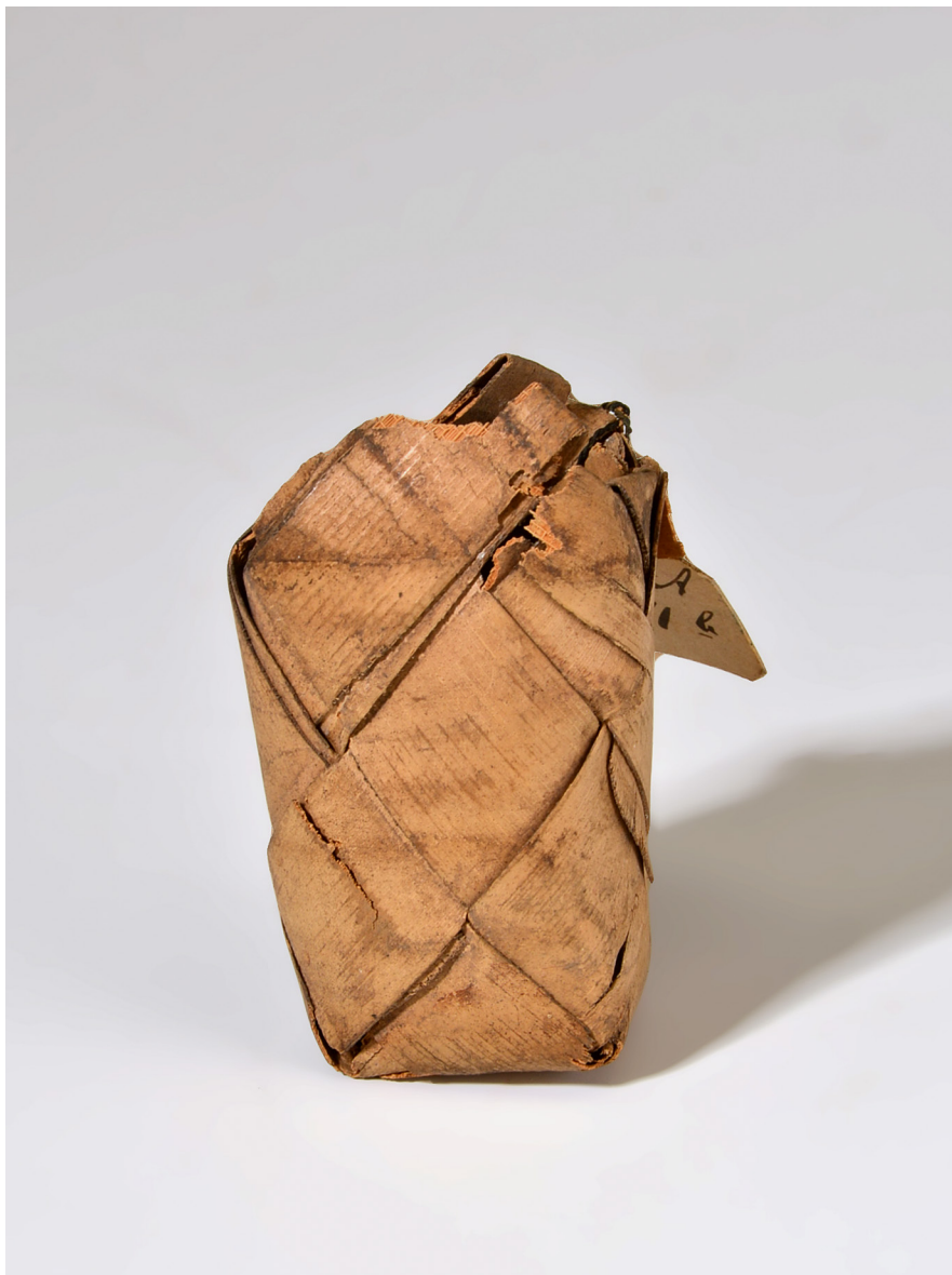
Abb. 14 | Penisfutteral, Westafrika, Togo, Tamberma, Sammler: Hermann Kersting, Inv.-Nr. V2.341.