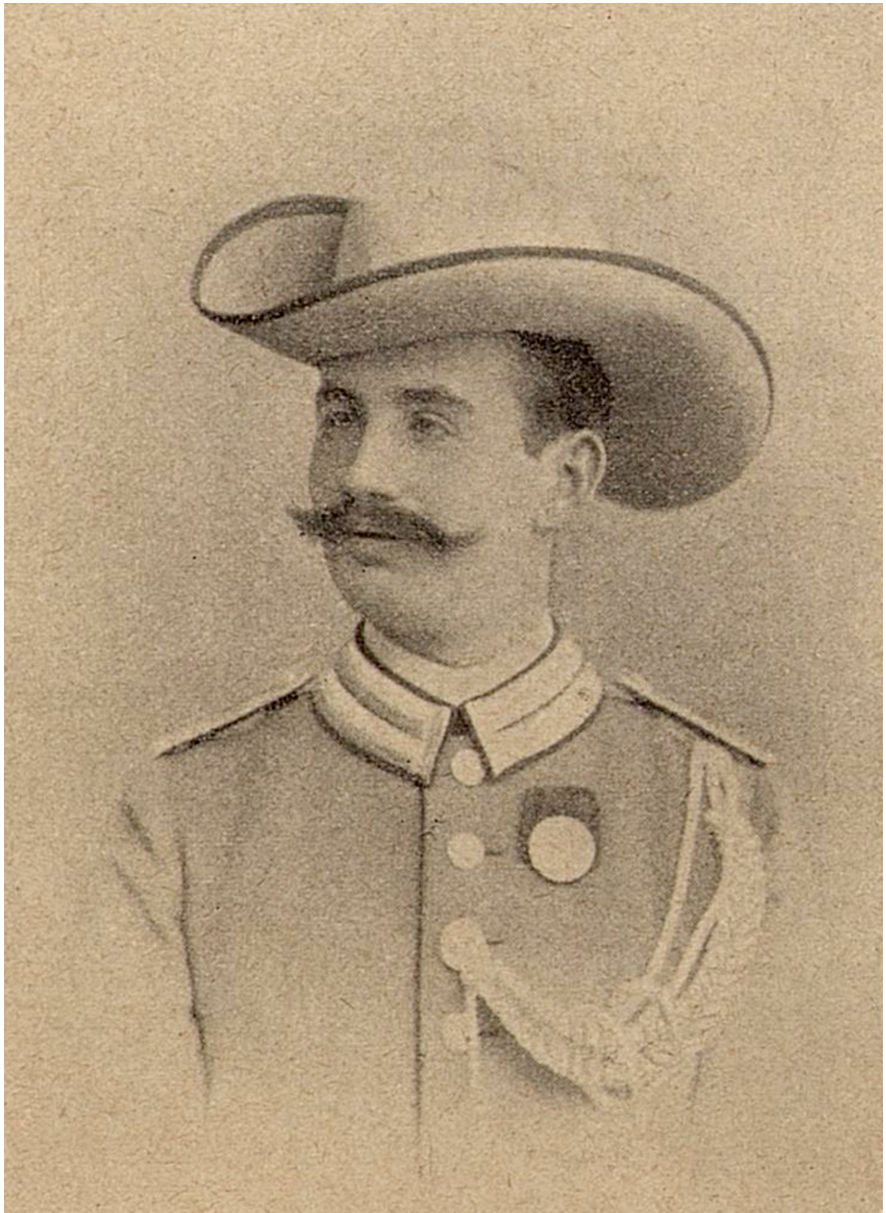
Abb. 20 | Gustav Adolf Wilhelm Laasch (aus Laasch 1905: 106)