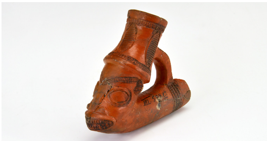
Abb. 21 | Pfeifenkopf, Westafrika, Kamerun, Bali, Sammler: Eugen Zintgraff. Inv.-Nr. V 1.709.

Von Eugen Zintgraff gesammelte Objekte erhielt das Roemer-Museum noch zu seinen Lebzeiten 74 aus dem 3. Berliner Dublettenverzeichnis 1897 (V 1.709, ein Pfeifenkopf aus Ton, und V 1.725, eine geflochtene Tasche, bei-