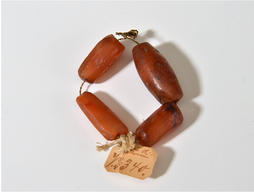
Abb. 18 | Karneol-Perlen, Westafrika, Nord-Togo, Sammler: Gaston Thierry, Inv.-Nr. V2.340 a.–d.

Verhandlungen über den Verbleib der Dubletten aus der Sammlung des verstorbenen Gaston Thierry. 45