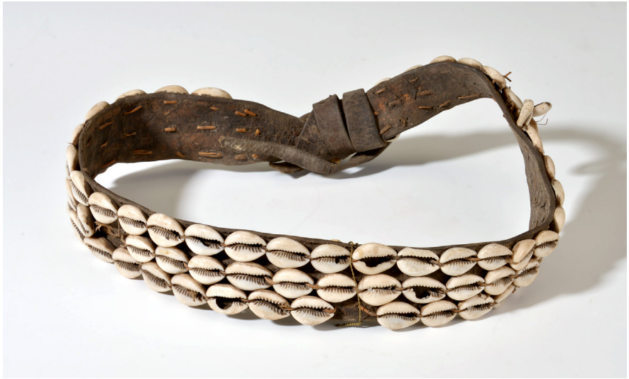
Abb. 25 | Ledergürtel mit Kaurischnecken, Zentralafrika, Zaire (heute: DR Kongo), Bakondjo, Sammler: Adolf Friedrich Herzog zu Mecklenburg, Inv.-Nr. V5.939.

Mus. f. Völkerkunde z. Berlin, Kauf, Slg. des Herzogs Adolf Friedrich zu Mecklenburg.“ Von den ursprünglich 27 Objekten fanden die Verfasserinnen bei einer Sichtung der entsprechenden ethnologischen Magazinbestände des RPM nur noch 14 vor.