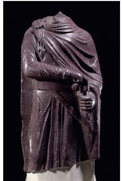
3 Ägypten [Alexandria] Torso einer Kaiserstatue, 4. Jh.

Als Philipp von Stosch kurz vor seinem Tod Johann Joachim Winckelmann (1717–1768) kennenlernte, der heute als Begründer der wissenschaftlichen Archäologie und Kunstgeschichte gilt, beauftragte er ihn mit der Erstellung eines Katalogs seiner berühmten Sammlung antiker Gemmen (geschnittene Halbedelsteine). Beendet wurde das Werk (»Description des pierres gravées du feu Baron de Stosch«, 1760) jedoch erst im Auftrag seines Neffen und Alleinerben Heinrich Wilhelm Muzel-Stosch (1723–1782), der wie sein verstorbener