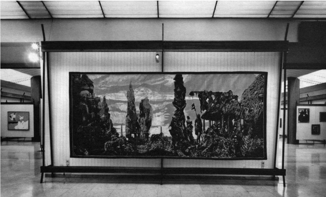
106 Vue de l'exposition «Le muse inquietanti. Maestri del surrealismo»