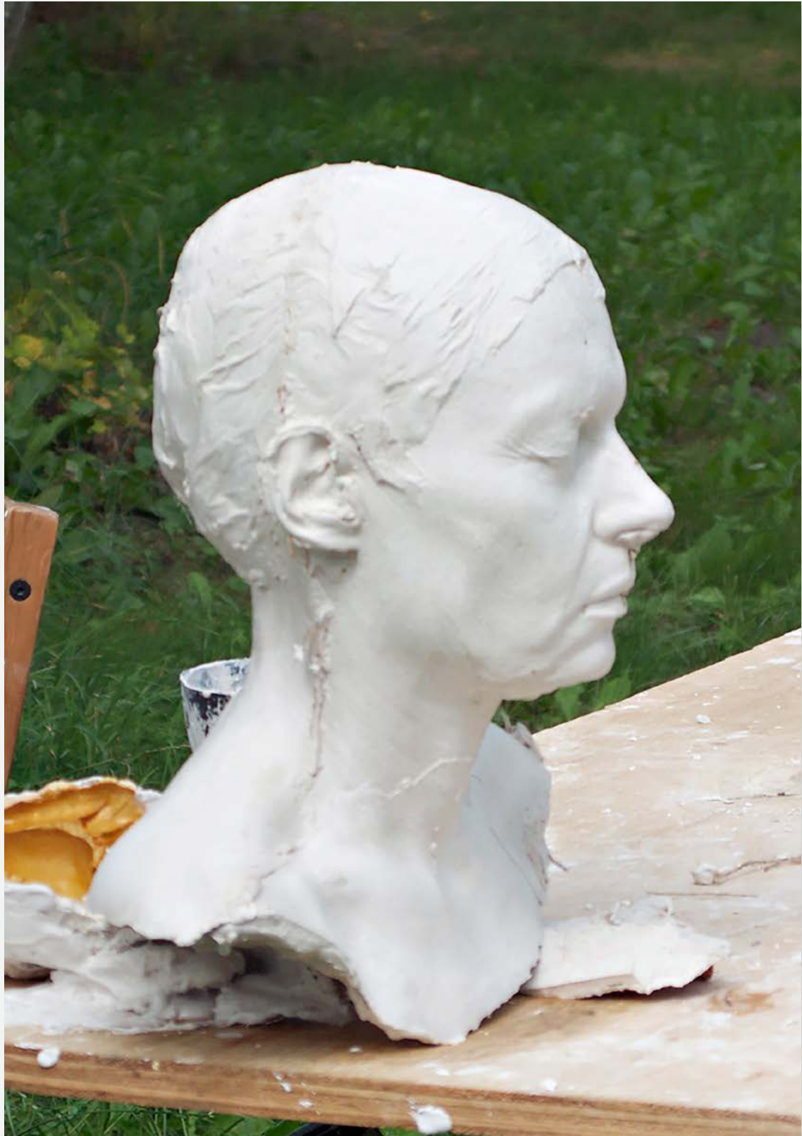
Figure 7 Modell des Kopfes