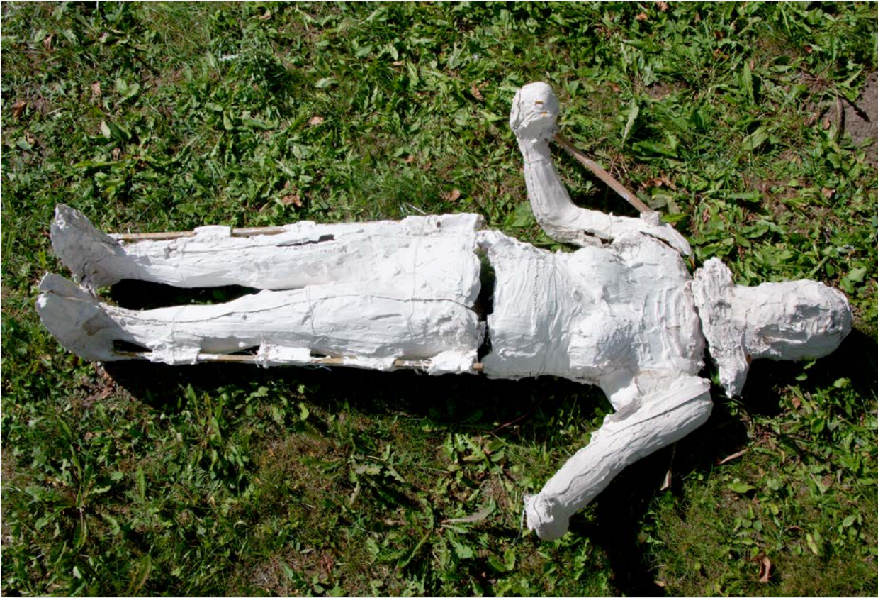
Figure 8 Im Feld

Geduld und Körperkontrolle auf der anderen Seite. Bei der Anfertigung der Negativform wird Gips direkt auf den Körper aufgetragen, er tastet die Oberfläche des Körpers mit all seinen Besonderheiten ab. Der Gips ist beim Auftrag sehr kalt, die Abformung bildet daher die hervorgehobene Gänsehaut genau ab. Auch die feine Körperbehaarung ist in den Negativformschalen abzulesen. Man sieht die Härchen regelrecht zu Berge stehen. Die direkte Reaktion des menschlichen Körpers auf das Material verfestigt sich in der Abformung. Eine momentane Versteinigung des realen Abformungsprozesses wird sichtbar.