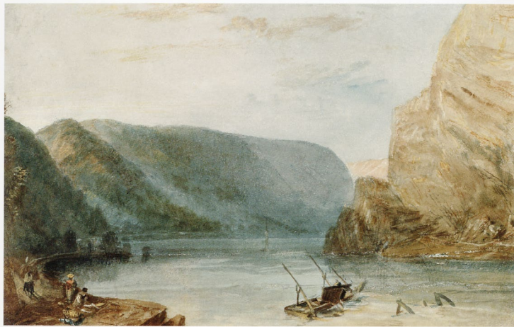
Abb. 1 Joseph William Turner: Lorelei , 1817.

Die Erwartungshaltung des englischen Reisepublikums war also schon vorgeprägt. Wie sehr die Ufer zwischen Köln und Mainz den englischen Vorstellungen von einer pittoresken Landschaft auf dem europäischen Festland entsprachen, geht auch aus John Gardnors Subskriptionstext für eine Folge von Aquatinta-Radierungen aus dem Jahre 1788 hervor: