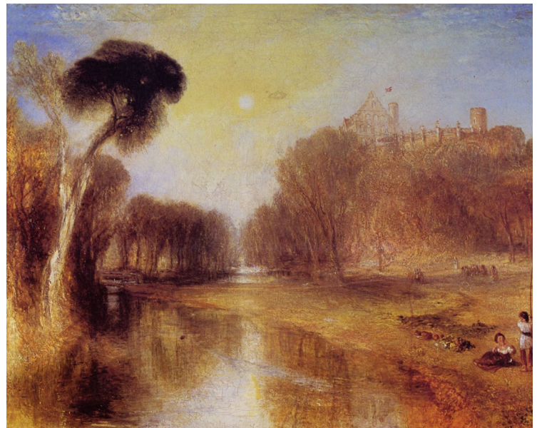
Abb. 4 Joseph William Turner: Schloss Rosenau, Seat of HRH Prince Albert of Sachsen-Coburg-Gotha, near Coburg, Germany, 1841.

Das Verflimmern des historischen Motivs im Blätterwald des Goldenen Oktobers, man findet es ganz ähnlich auch in dem für König Ludwig I. von Bayern geplanten Bild der Walhalla bei Regensburg von 1842, das aber ebenfalls bei seinem Adressaten scheiterte. 22 Beide