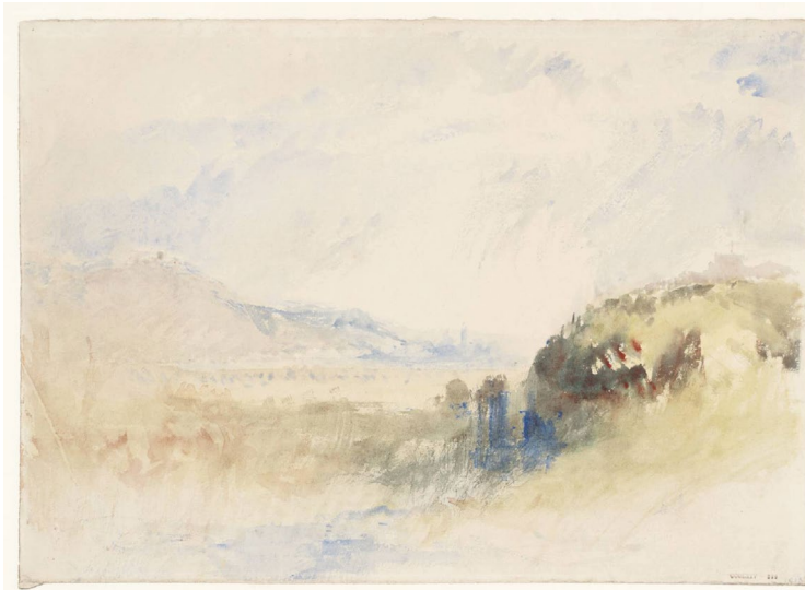
Abb. 5 Joseph William Turner: Schloss Rosenau, near Coburg: The Birthplace of H. R. H. Prince Albert , 1840.