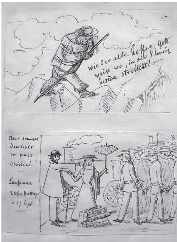
Abb. 184: Reiseskizzenalbum „Am Genfer See“, Heinrich Hoffmann, 1868.

Deutscher Eisenbahn-Verkehrsverband, 1935 Papier, bedruckt H. 29,6, B. 21,2 cm DB Museum Nürnberg; Inv.Nr. Dokumentationsstelle DV 650(1)