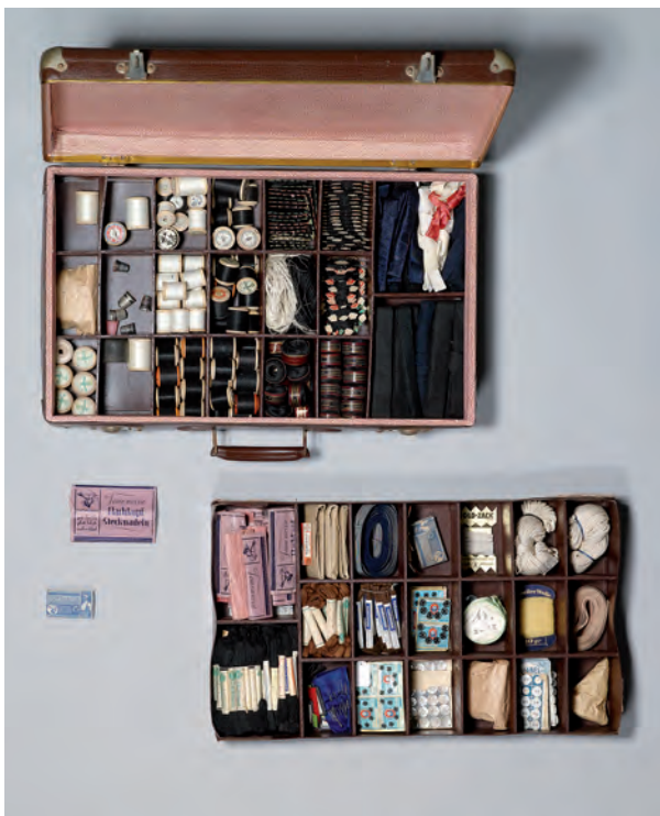
Abb. 182: Musterkoffer eines Kleinwarenhändlers, Süddeutschland, um 1950–1960. Heimatmuseum des Marktes Schnaittach.

Süddeutschland, um 1950–1960 Hartpappe geprägt, braun (Lederimitat), Kofferecken, Schlösser Eisenblech, vernickelt (?), Futter Papier, Einsätze Pappe, Sperrholz, Kurzwaren H. 16,5, L. 65, B. 36,7 cm Heimatmuseum des Marktes Schnaittach