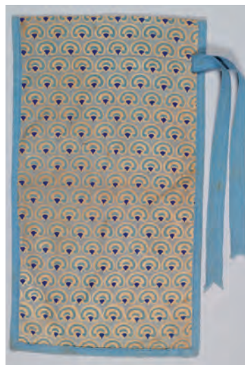
Abb. 183: Bedruckter Schuhbeutel, Deutschland, um 1910. Sigmund Freiherr von Hallersche Familienstiftung.

Bez. „C.S.“ Umkreis Peter Behrens, Nürnberg (?), um 1902 Baumwolle, Körperbindung, weiß, Stickerei Plattstich, Cellulosefaser, blau, H. 33,5, B. 32 cm Germanisches Nationalmuseum, Nürnberg; Inv.Nr. Gew 5128