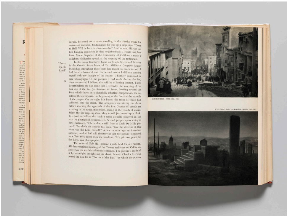
1. Arnold Genthe, Doppelseite aus As I Remember , 1936.