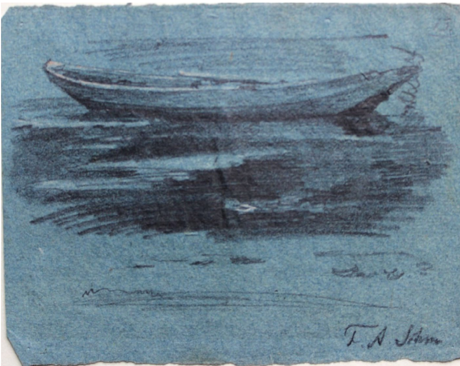
HANDSKIZZE 4 nach dem 2.9.1913, Blei/Papier blaugrau, 12 × 15,5 cm, (mit der linken Hand gezeichnet), Privatbesitz, FAS-Nr. 527.