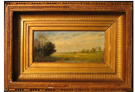
LANDSCHAFT MIT SPIELENDE KIDERN , 1875, Öl auf Leinwand/Karton, 12,5 × 27 cm, sign., Privatbesitz, FAS-Nr. 7.