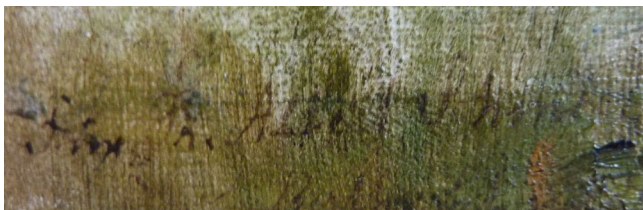
WIESENLANDSCHAFT , um 1874, Öl auf Leinwand, 33 × 61,5 cm, sign., Privatbesitz, FAS-Nr. 6.