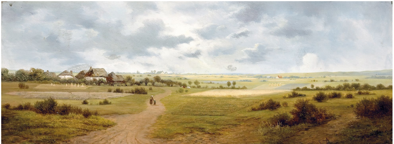
SOMMERLANDSCHAFT [Frau mit Kind beim Dorf] , 1874, Öl auf Holz, 20 × 56 cm, sign., Privatbesitz, FAS-Nr. 3.