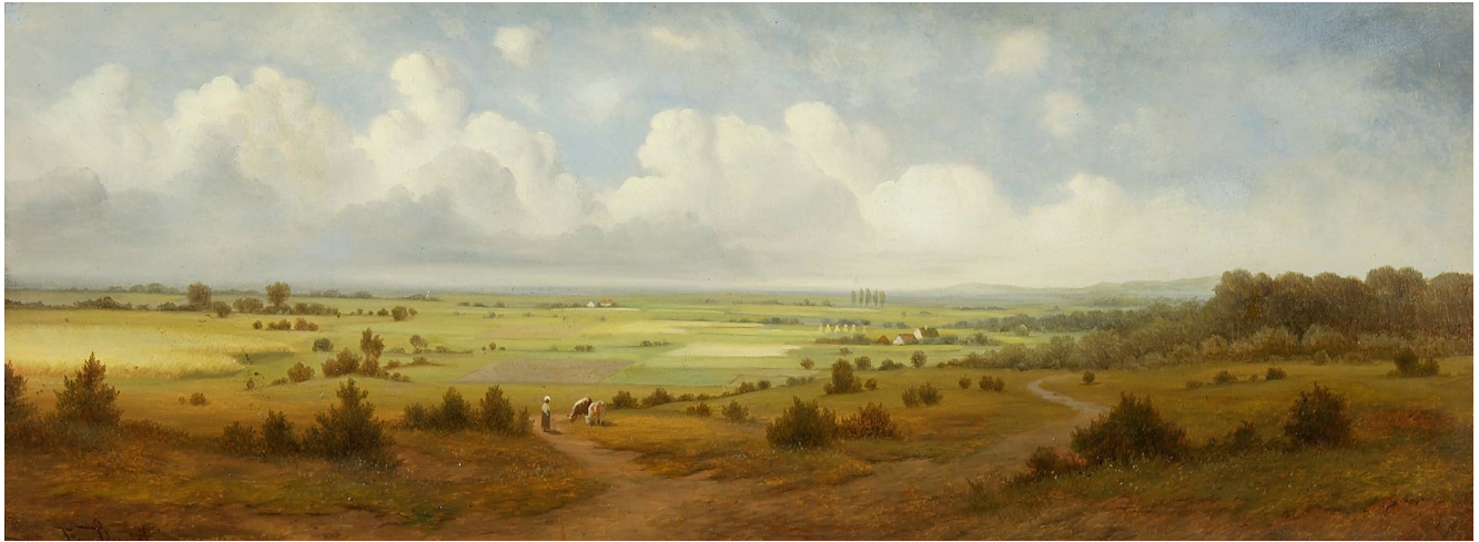
SOMMERLANDSCHAFT [Bäuerin mit Kühen] , 1874, Öl auf Holz, 21 × 55 cm, sign., Privatbesitz, FAS-Nr. 2.

München, Dachau, Bernried, Burgenland (Anschütz, Diez)