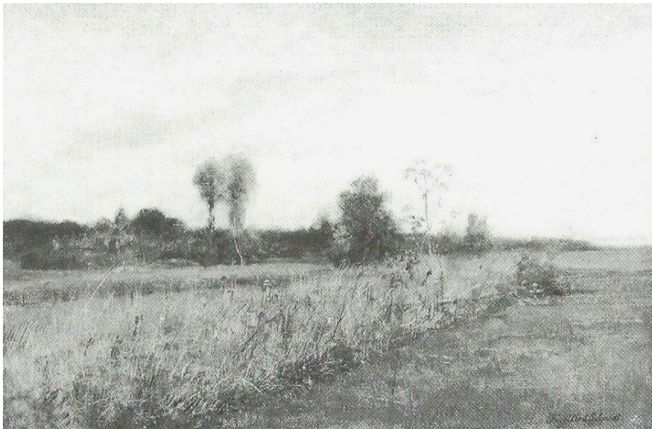
WEITE WIESENLANDSCHAFT , 1874, Öl auf Leinwand, 35,5 × 54,5 cm, sign., Privatbesitz, FAS-Nr. 1.

München, Dachau, Bernried, Burgenland (Anschütz, Diez)