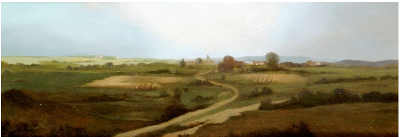
HÜGELIGE LANDSCHAFT [Burgenland] , um 1874, Öl auf Holz, 20 × 54 cm, sign., Privatbesitz, FAS-Nr. 51.