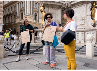
→ Fig. 7: Kolonialität in der Wiener Innenstadt; Pestsäule, 2022. Decolonizing in Vienna! , Foto: Marisel Bongola.