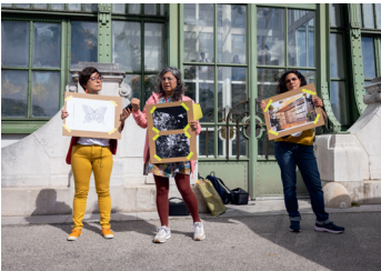
→ Fig. 10: Kolonialität in der Wiener Innenstadt; Schmetterlinghaus, 2022. Decolonizing in Vienna!