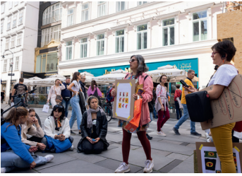
→ Fig. 8: Kolonialität in der Wiener Innenstadt; Julius-Meisl-Filiale und Geschichte, 2022. Decolonizing in Vienna! , Foto: Marisel Bongola.