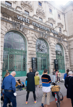
→ Fig. 9: Kolonialität in der Wiener Innenstadt; Weltmuseum Wien, 2022. Decolonizing in Vienna!