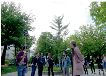
→ Fig. 2: Hietzing kolonial – Deconstructing white Innocence, 2021. Decolonizing in Vienna! , Foto: Fabio Büchler.