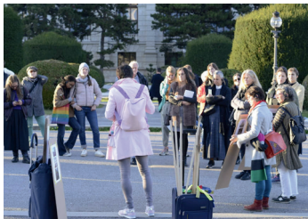
→ Fig. 3: Wiener Innenstadt, Naturhistorisches Museum, 2021. Decolonizing in Vienna!