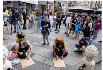
→ Fig. 6: Kolonialität in der Wiener Innenstadt II; Pestsäule, 2022. Decolonizing in Vienna!