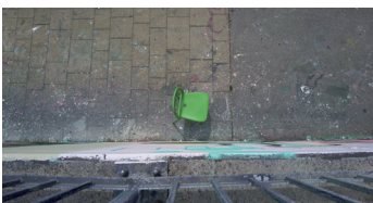
→ Abb. 2–7