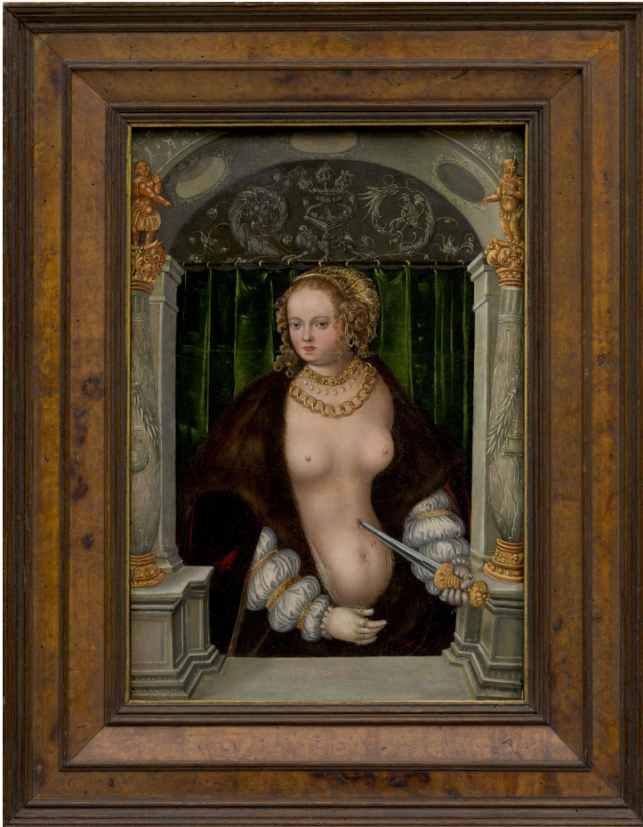
Abbildung 7 Werkstatt von Lucas Cranach d. Ä., Selbstmord der Lucretia , um 1535, Öl auf Holz, Foto: © Peter Cox/Bonnefanten, loan Cultural Heritage Agency of the Netherlands.

Kunstwerke“ erstellt, das neben zahlreichen weiteren auch den im März 1941 getätigten Ankauf mit Angabe der Provenienz Kunsthandlung de Boer und des Preises in Höhe von 5.830,80 RM auflistet. 51