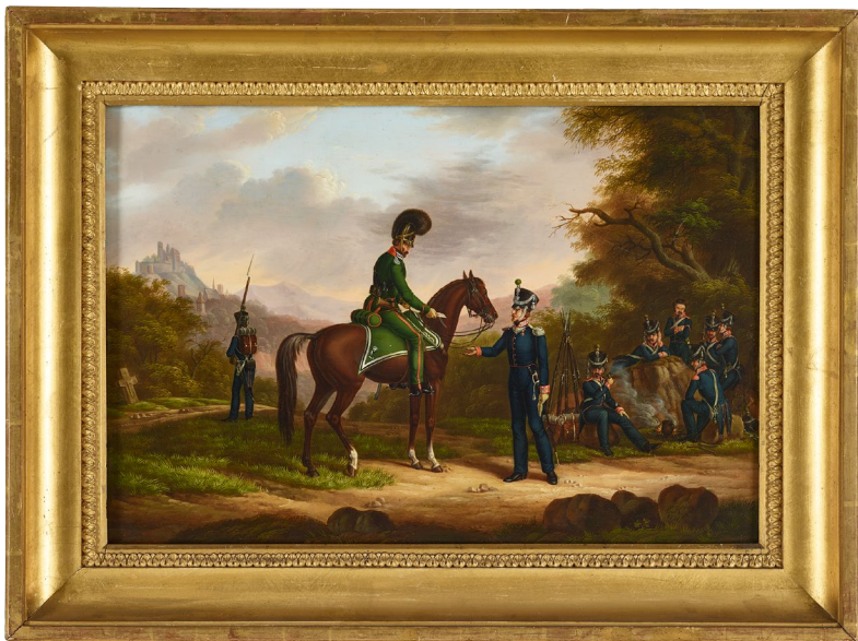
Abbildung 4 Eduard Kehrer (1812–1863), Hessisches Militär in einer Landschaft (Hessische Dragoner) , 1831, Öl auf Holz, Foto: Wolfgang Fuhrmanek, ©HLMD CC BY-SA 4.0.