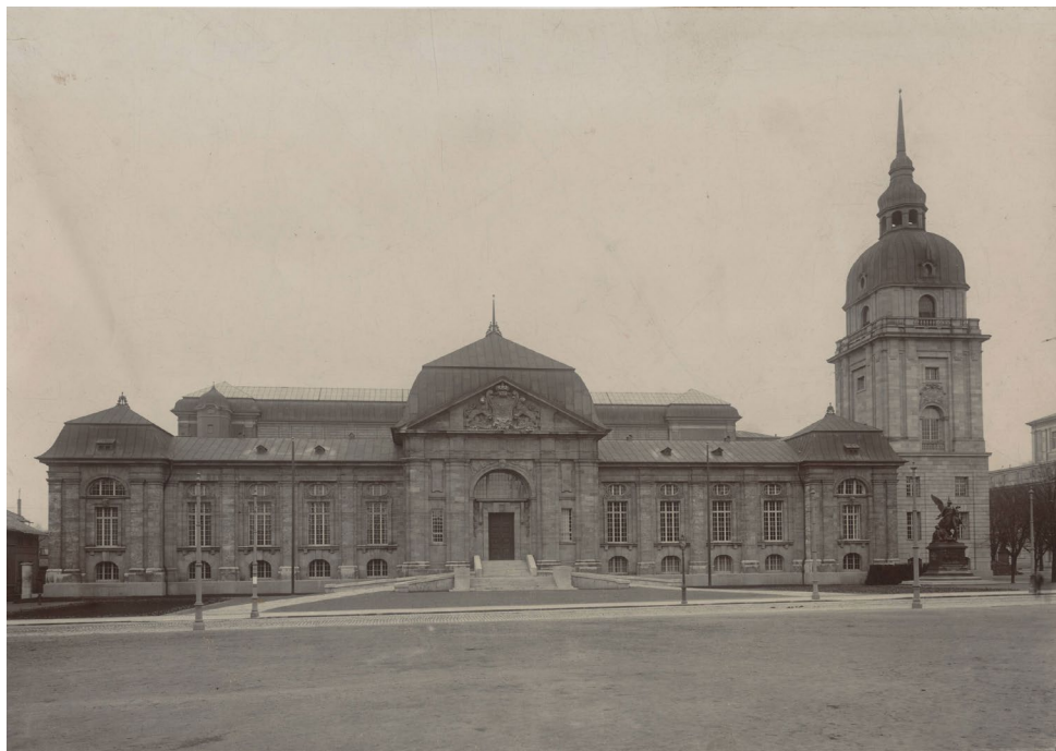
Abbildung 1 Darmstadt, Hessisches Landesmuseum / Südseite, 1940, Foto: HStAD, R 4 9270, © HStAD.

publiziert. 1 Speziell zum Sammlungsbereich der Gemäldegalerie wurden mehrere wissenschaftliche Bestandskataloge erarbeitet, denen neben Erläuterungen zur Institutions- und Sammlungsgeschichte des Museums auch erste Provenienzzangaben zu entnehmen sind. So erfasst der 1979 erschienene Katalogband Malerei 1800 bis um 1900 die außerhessische Malerei des 19. Jahrhunderts. 2 Es folgte 1997 der Katalog der Gemälde des 18. Jahrhunderts im Hessischen Landesmuseum und 2003 der Bestandskatalog der Gemälde hessischer Maler des 19. Jahrhunderts im Hessischen Landesmuseum . 3