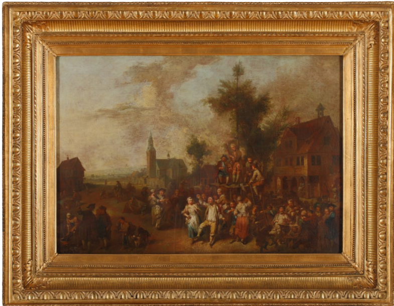
Abbildung 3 Johann Conrad Seekatz (1719–1768), Großes Kirchweihfest in Gross-Gerau , um 1759/60, Öl auf Leinwand, Foto: Wolfgang Fuhrmanek, ©HLMD CC BY-SA 4.0.