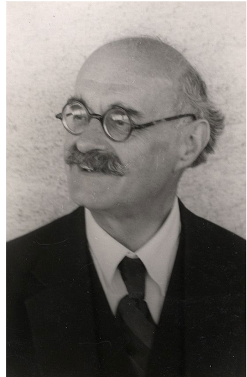
Abbildung 2 August Feigel (1880–1966), Foto: HStAD Bestand H 3 Darmstadt Nr. 2414, © HStAD.

Die bereits erwähnte fehlende Quellenüberlieferung stellte für die Provenienzforschungen zu den Gemäldeerwerbungen eine große Herausforderung dar. Zumal sich auch keine Gegenüberlieferungen beim vorgesetzten hessischen Staatsministerium erhalten haben. 19