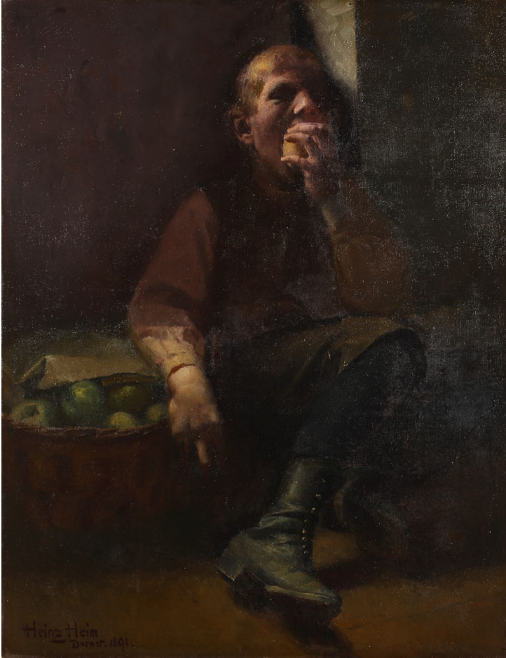
Abbildung 6 Heinz Heim (1859–1895), Der Apfeldieb (Der Apfelesser) , 1891, Öl auf Leinwand, Foto: Wolfgang Fuhrmannek, ©HLMD CC BY-SA 4.0.

Aufzeichnungen zu Vorgängen übergab, von denen sie vermutete, dass es sich um ehemaligen jüdischen Besitz handeln könnte. Der Verbleib dieser Geschäftsbücher ist bislang unbekannt. Über die von Margarethe Hahn erstellten Listen hinaus haben sich offenbar keine Unterlagen des Auktionshauses Heinrich Hahn erhalten. 46