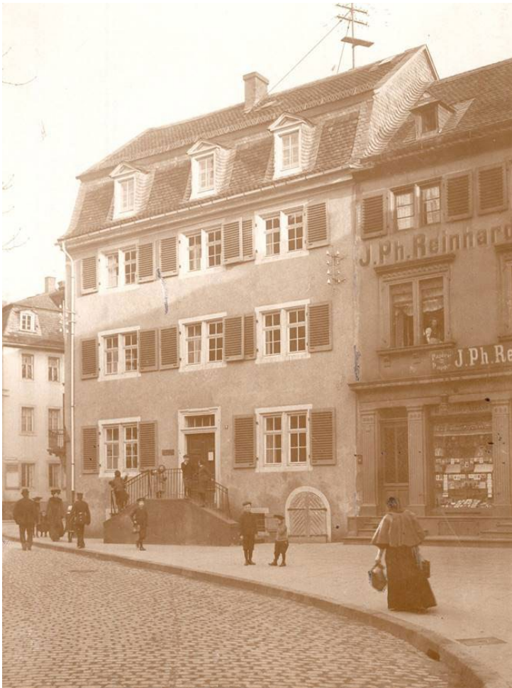
Abbildung 1 Das Haus Schlossgraben Nr. 9 war Domizil des Stadtmuseums von 1909 bis 1935, Foto: Unbekannt, StadtA DA, Bestand 53-10374, ©StadtA DA.

Einen Schwerpunkt der Bestände stellten Gemälde, Aquarelle und Zeichnungen Darmstädter Malerei des 19. Jahrhunderts dar. Darunter waren Werke von August Lucas (1803–1863), August Becker (1821–1887), Heinrich Hoffmann (1816–1891), August Noack (1822–1905), Carl Beyer (1826–1903), Ludwig Seeger (1808–1866), Ernst Eimer (1881–1960) und Franz Harres (1809–1835). Trotz der großen Zahl an Gemälden war man im Stadtmuseum bestrebt, die eigenen Sammlungen von denen des Hessischen Landesmuseums und der im Aufbau befindlichen Modernen Galerie