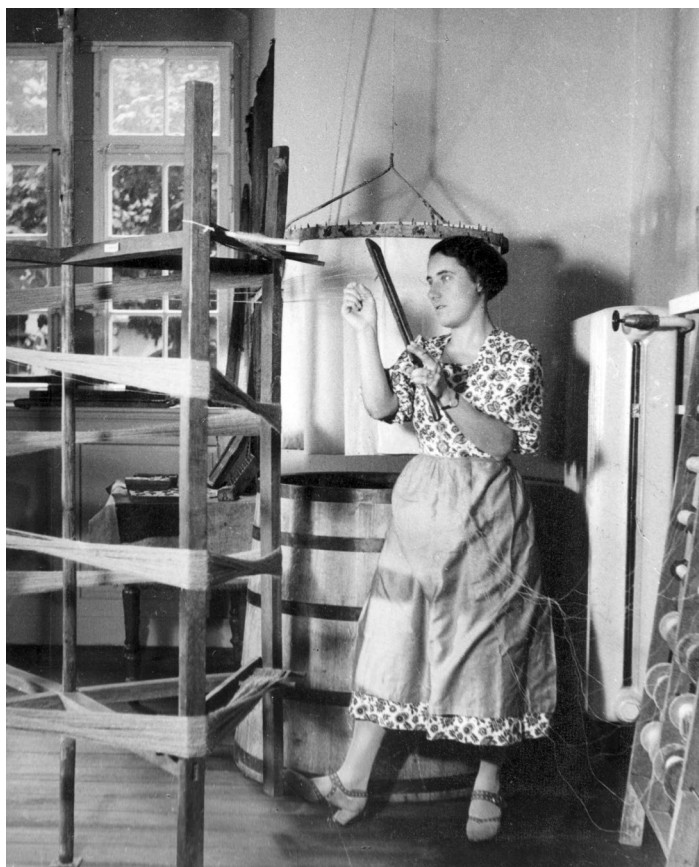
Abbildung 6 Vorführung von Handwerkstechniken im Stadtmuseum, hier an der Garnhaspel, um 1935, Foto: vermutlich W. Jacobi, StadtA DA, Bestand 53, © StadtA DA.

Die Darstellung Odenwälder Handwerkstraditionen erstreckte sich über Erdgeschoss und ersten Stock. Im Erdgeschoss waren drei Räume für Küche, Schlafstube und Wohnstube Odenwälder Bauern aus den 1850er Jahren reserviert. Räume mit einer in Betrieb befindlichen Weberei und Töpferei kamen hinzu. An den Webstühlen und an den Spinnrädern konnte altes Handwerk ebenso vorgeführt werden wie an der Töpferscheibe (Abb. 5, 6), auch die Blaudruckfärberei wurde präsentiert.