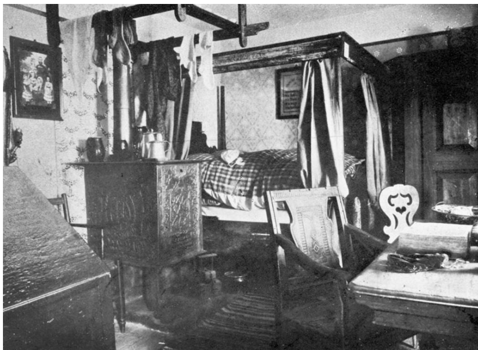
Abbildung 2 Die Odenwälder Bauernstube im Stadtmuseum am Schlossgraben um 1910, Foto: Unbekannt, StadtA DA, Bestand 53, © StadtA DA.

des Ständigen Rates zur Pflege der Kunst in Hessen , der Keimzelle der künftigen Städtischen Kunstsammlung 3 , abzugrenzen.