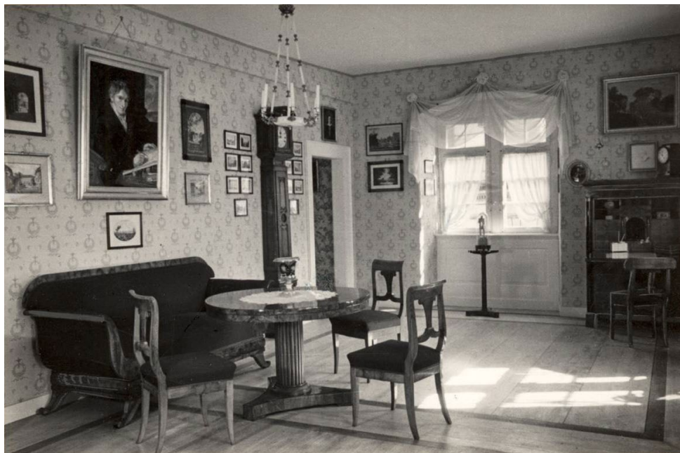
Abbildung 8 Biedermeierzimmer (Mollerzimmer) im Stadtmuseum 1935, alle Einrichtungsgegenstände sind 1944 verbrannt, Foto: Luise Brockmeyer, StadtA DA, Bestand 53, © StadtA DA.

Heimatwerks“ zur Förderung der bäuerlichen Handwerkskultur und Volkskunst gezeigt, die in Verbindung mit dem „Reichsnährstand“ eine „sehr anregende Ausstellung von künstlerisch vollendeten Textilien als Erzeugnisse des heimischen Fleißes“ 9 präsentierte, vor allem Handwebereien und Handstickereien. Unter den ausgestellten Museumsobjekten waren auch Leihgaben aus dem Staatsarchiv, dem Schlossmuseum, dem Hessischen Landesmuseum sowie der Landesbibliothek. 10