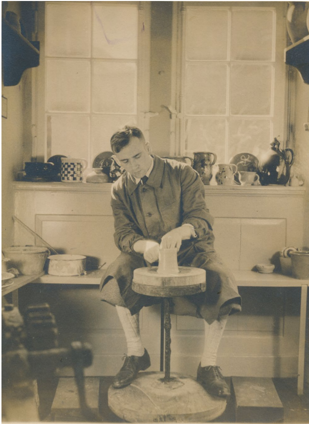
Abbildung 5 Vorführung von Handwerkstechniken im Stadtmuseum, hier an der Töpferscheibe, um 1935, Foto: W. Jacobi, StadtA DA, Bestand 53-10353, © StadtA DA.

viel mehr Platz für die Präsentation der Sammlungen zur Verfügung stand. Nach Beendigung des museumsgerechten Ausbaus durch das städtische Hochbauamt wurde das nunmehrige Heimatmuseum am 20. März 1935 eröffnet. 5