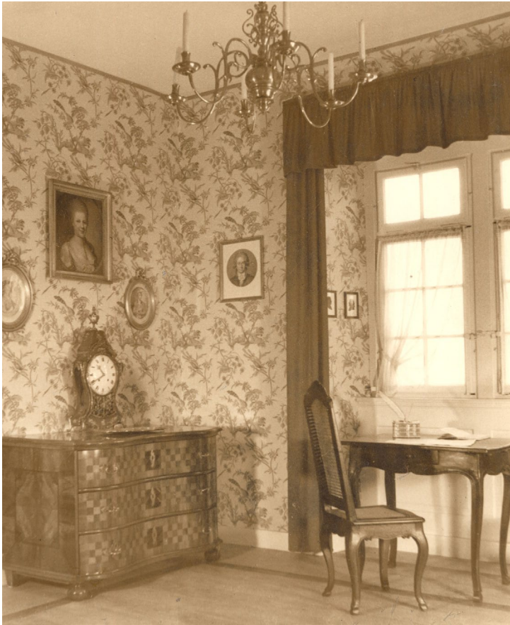
Abbildung 7 Rokozimmer (Merck-Goethe-Zimmer) im Stadtmuseum 1935, Foto: vermutlich Luise Brockmeyer, StadtA DA, Bestand 53, ©StadtA DA.

eine Art Idealtypus eines modernen Heimatmuseums im Geiste des Nationalsozialismus, welches sich von anderen Heimatmuseen der Zeit abhob. 8