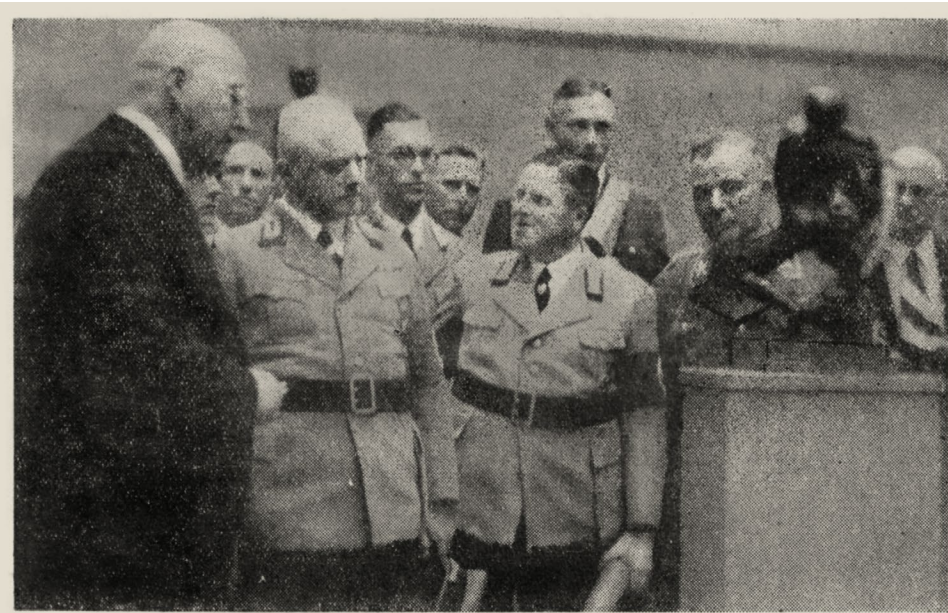
Gauleiter und Kreisleiter auf einem Rundgang durch die Ausstellung.

Unter den völlig veränderten politischen Rahmenbedingungen des Nationalsozialismus 38 Jahre später sollte nun an diese Tradition angeknüpft werden. Bei der Eröffnung der städtischen Galerie war neben dem Oberbürgermeister der Stadt und