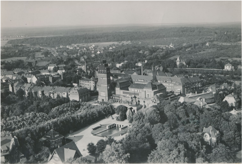
Abbildung 1 Die Mathildenhöhe in den 1930er Jahren

Die Städtische Kunstsammlung vereinte Werke der Malerei, Graphik, Zeichnung, Skulptur und Plastik sowie eine Plaketten- und Medaillensammlung unterschiedlicher Provenienz.