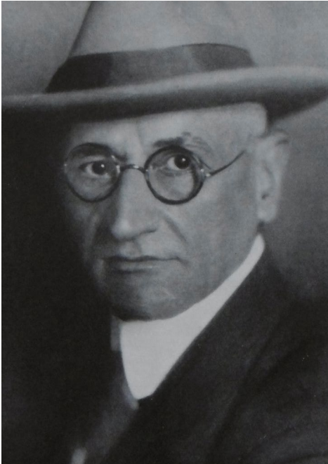
Abbildung 4 Rudolf Mueller (1869–1954), Darmstads letzter demokratisch gewählter Oberbürgermeister um 1924, Foto: Hermann Collmann, der Publikation Kunst und Leben im Darmstadt von heute , hg. v. Bürgermeister Mueller, Darmstadt 1925, S. 9 entnommen, © Institut Mathildenhöhe.

Einem Konsortium bestehend aus Wamboldt, weiteren Vertreterinnen und Vertretern der Stadt, des Landesmuseums sowie des Volksstaates Hessen stellte der NSDAP-Ratsherr, Künstler und Kunstpolitiker Beyer am 7. November 1935 seinen Plan für eine zusätzliche Dauerausstellung bildender Kunst in der Stadt vor. 9 Das von ihm vorgetragene Konzept basierte auf Ideen, welche bereits viele Jahre vor der Zeit des Nationalsozialismus mehrfach diskutiert worden waren. 10