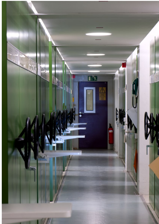
Abbildung 2 und 3 Innenaufnahme aus dem Magazin des Staatsarchivs Darmstadt, Foto: Nasser Amini, ©HSfAD.