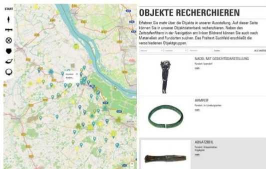
Abb. 3: Screenshot Webapp zur Objektrecherche der Museen Stade

In seinem Paper zum Thema „Generous Interfaces for Digital Cultural Collections“ hat Mitchell Whitelaw auf eine Unverhältnismäßigkeit von digital vorliegenden Sammlungen und deren Recherchierbarkeit aufmerksam gemacht. [6] Solch einem Defizit entgegenwirkend, wurde bei der diesjährigen Neukonzeptionierung der Museen Stade die Vermittlung der Inhalte in einem medial vermittelndem Gesamtkonzept berücksichtigt. So können Besucher ausgewählte Objektdaten an Medienstationen im Museum einsehen und recherchieren. Einige dieser Angebote sind auch von zuhause aus erreichbar.