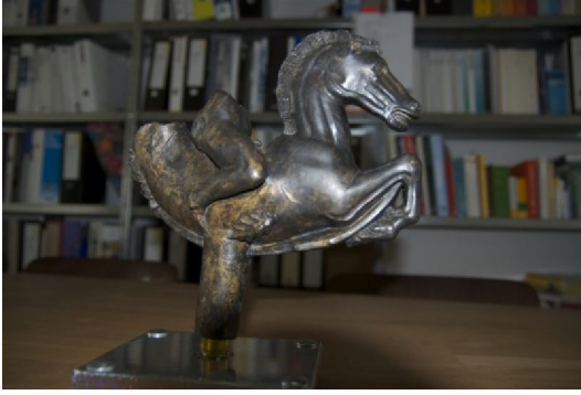
Abb. 5: Pferdeskulptur eines Brunnens aus der Renaissance