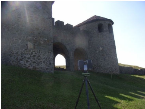
Abb. 1: Ost-Limes Porolissum

Das 3Dscannen und die 3D-Weiterverarbeitung bis zur 3D-Modellierung und des 3D-Drucks ist unser Know-how.