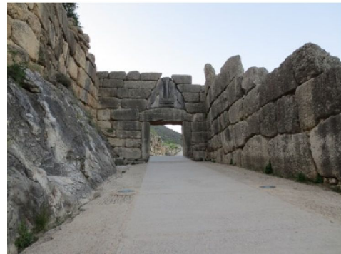
Abb. 3: Löwentor Mykene Griechenland