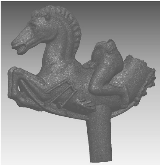
Abb. 7: Vermaschung der Pferdeskulptur