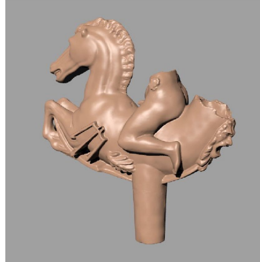
Abb. 8: Mustervisualisierung „Schokoladenseite“ der Pferdeskulptur