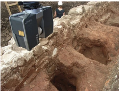
Abb. 2: Laserscanner